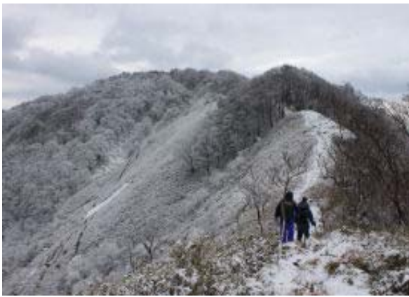
北稜線を戻る（前方、綿向）