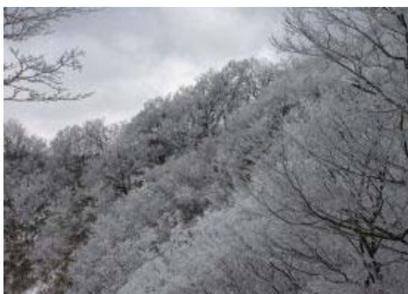
もうすぐ山頂・北側稜線

927 御幸橋 P 1023 三合目林道 1046-1055 五合目避難小屋 1147-1217 山頂・昼食 1232 北稜線① 1242 分岐② 1358 御幸橋 P