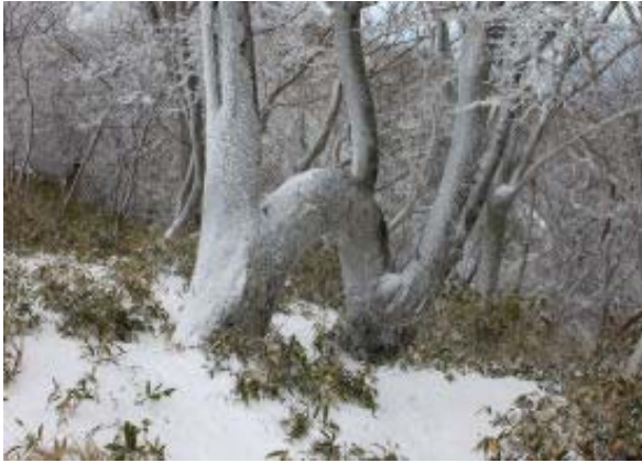
ブナの珍変木（北稜線）