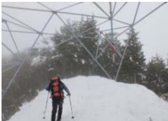
東光寺山手前鉄塔 ④

永源寺の北、日本コバの西にある山である。正直、魅力のある山とはいえない。雪はほとんどないと予想を裏切り、それなりに雪があった。気温は低く、ずっと雨具（暴風具）を着用していた。