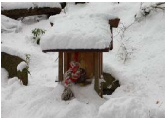
明神山頂・八大竜王祠