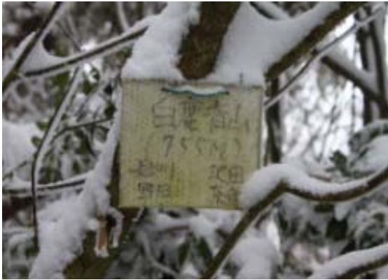
東光寺山頂（白鹿背山）