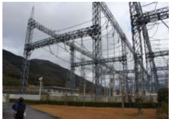
大きな東近江開閉所

天候が良くなかったので稜線からの景色もほとんどなく、東光寺山からの下りでようやく、東近江市を望むことができた。