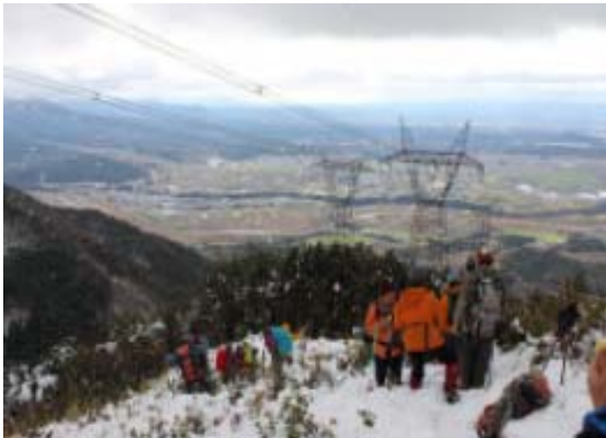
鉄塔に沿って下る