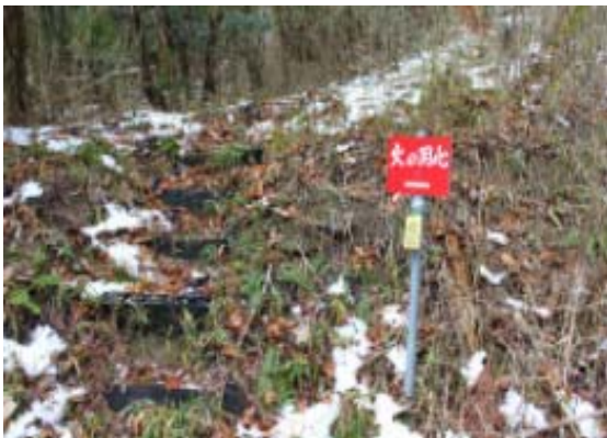
⑥よりも⑤-⑦ルートがベターのようだ