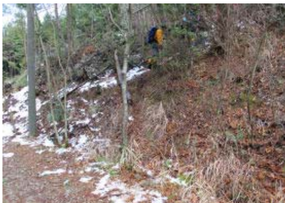
林道からの取り付き②

2010.1.10(日) くもり時々小雪 鈴鹿・高野山—明神山—東光寺山 SH 例会