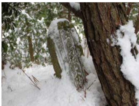
明神山手前の八鷹城大神祠