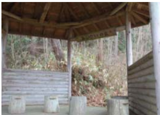
あじさいの丘 (休憩所)