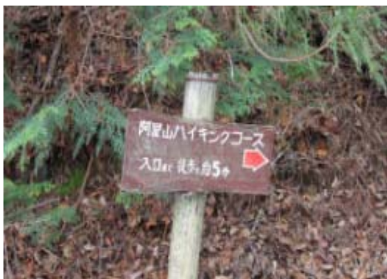
三叉路にある標識①

1106 駐車場① 1153-1219 山頂・昼食 1229 見晴台 1253 駐車場 その後車にて飯道山—阿星山縦走の下見を兼ね、畜産団地経由飯道神社の鳥居まで