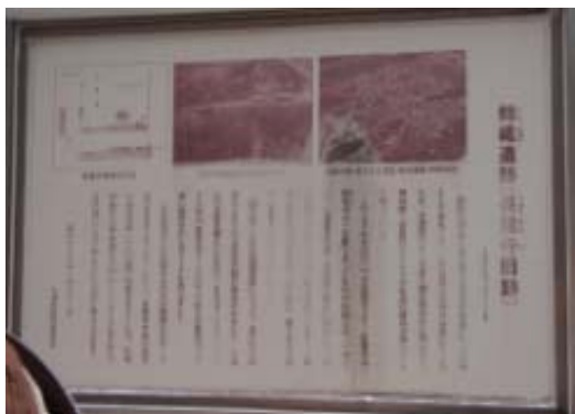
長蓮寺 (錦織遺跡) ②