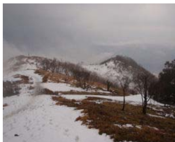
山頂より御殿山方面

今回の企画は武奈から釣瓶—ナガオ尾根—八淵であったのだが、時間切れで、武奈から八雲経由で下山となった。ナガオ尾根に期待していたので残念。