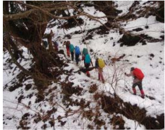
八雲ヶ原に向かう

とはいえ、御殿山も数年ぶりゆえ、御殿山からの武奈の大きさには改めて感心した。雪はほとんどなく、下山でアイゼンは装着したもののほとんど不要の状況であった。武奈からの下りで4時間要しているが、以前はイン谷口からバスに乗っていたので3時間強の下りであった。武奈が琵琶湖側から遠くなったとつくづく思う。春の新緑時にナガオ尾根に行ってみたいと思う。