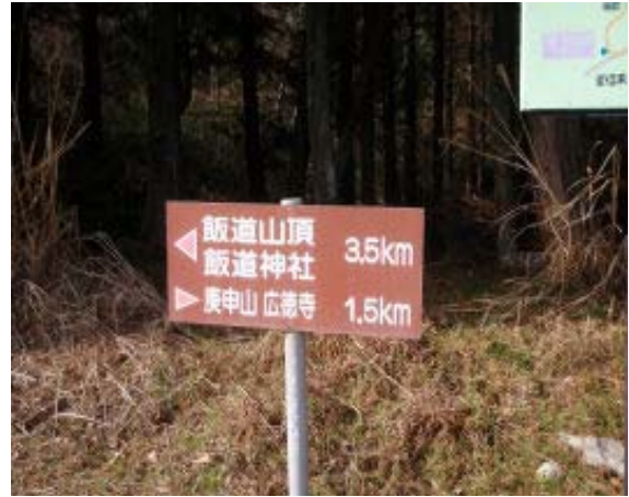
地点⑱ 林道、但し、左行きは施錠