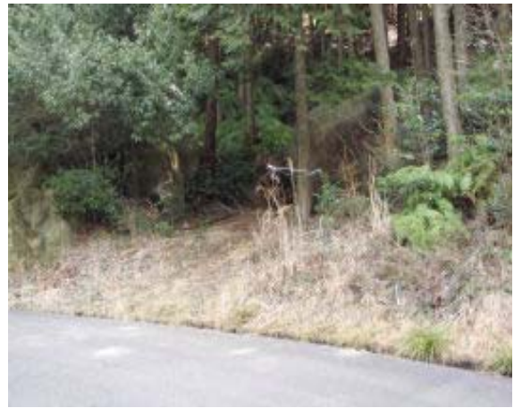
地点③ 100225のルート(のぼり)