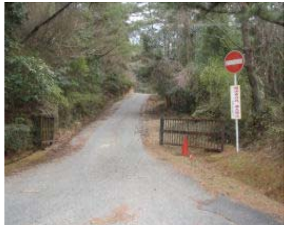
地点⑮ 甲賀カントリー管理道路（開錠）

林道はゴルフ場も管理しているようであり、開錠しているが、入れば、ゴルフの球に当たりそうな雰囲気。地点⑯は写真を撮り忘れたが、開錠していた。飯道山には神社側からがもっとも短縮コースかもしれない。