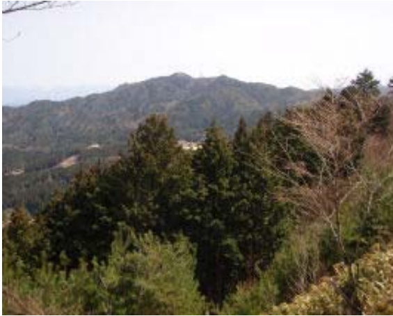
地点④ より 阿星山