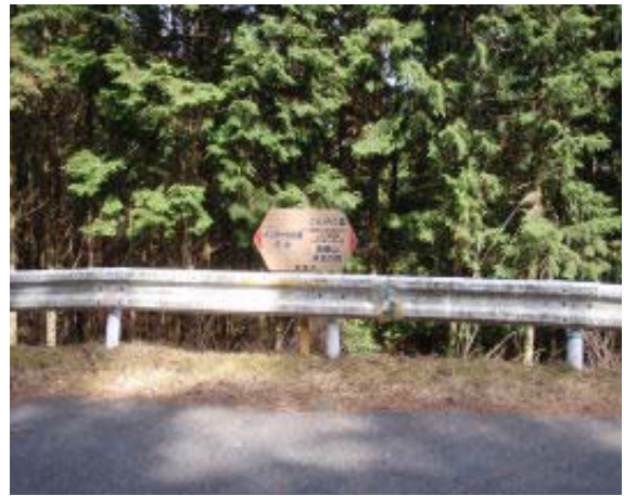
地点⑦ ナンダサカへの分岐