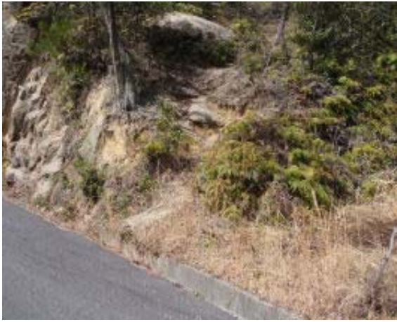
地点① 鶏冠山への近道

結果的には2日間の車旅となった。14日は飯道神社から山頂に、17日は林道から鶏冠山に登ることができた。