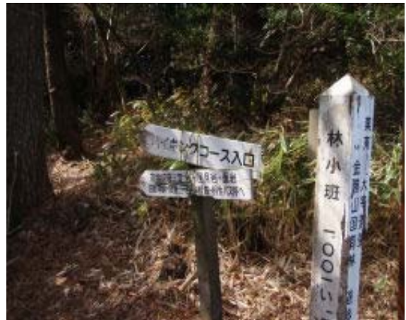
地点④ 竜王山への標識

まずは山入・片山方面から金勝アルプスの林道に行く。地点①の上り口が気になる。帰宅後、調べた結果が先述のとおり。馬頭観音堂の駐車場はハイキングコースの駐車場にもなっており、10台は駐車可能。金勝寺は大きな境内をもつ寺であり、散歩にもよさそう。