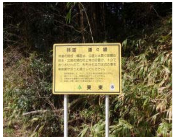
地点⑨ 林道 道々線

寺の南には大杉と名づけられたりっば杉が1本ある。金勝アルプス周辺の林道はほとんどが開放されているようだ。地点⑬にはりっばな階段があり、未確認だが、山頂に続いているのかも。一方、飯道山周辺の林道はほとんど施錠されている。また、ゴルフ場近辺の