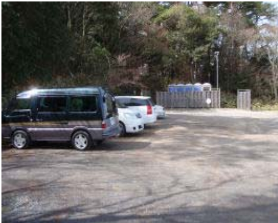
地点④ 馬頭観音堂駐車場