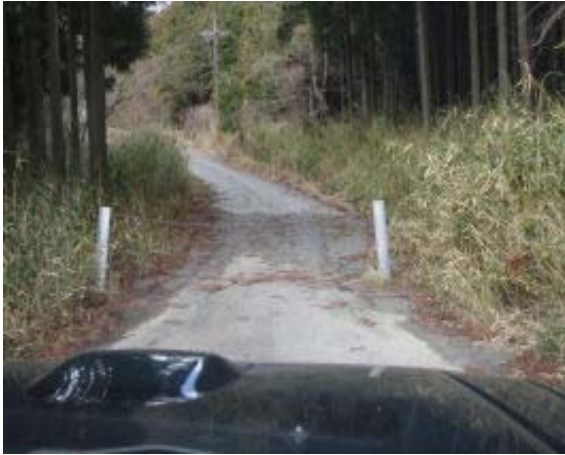
地点⑯ 大納言への林道（施錠）