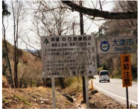
地点⑪ 心行路線終点 地点⑭から来る