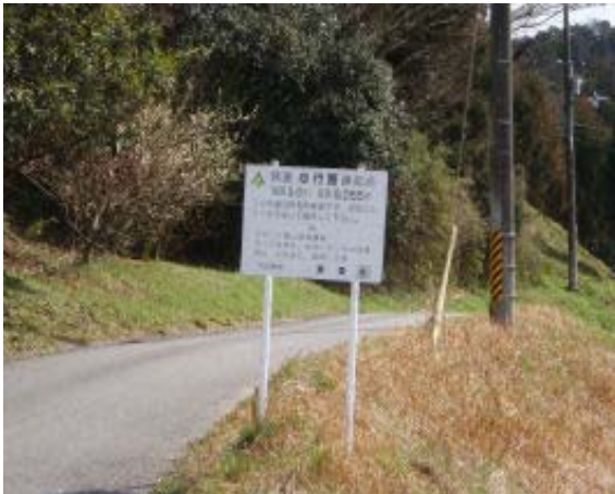
地点⑭ 心行路線起点