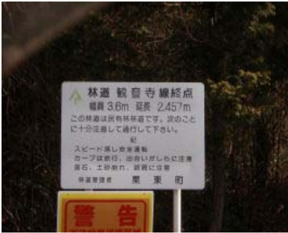
地点⑫ 観音寺線終点