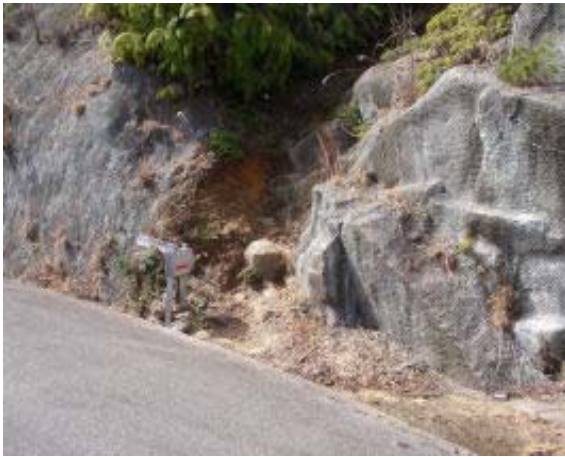
地点② 100225のルート(くだり)

17日に鶏冠山に登れたのは14日のデータももとにこのルートは天狗岩と鶏冠山の鞍部に行っていると読んだからであった。