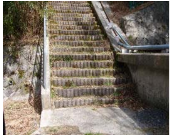
地点⑬ 山頂のアンテナメンテ階段？