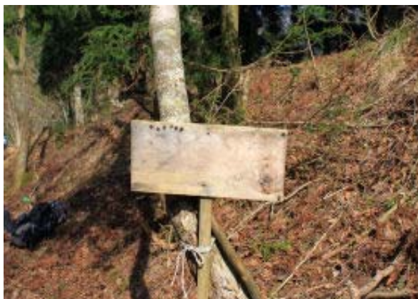
ツツロ坂峠 (文字みえず)

900 ツツロ坂峠 1019 最高点 1123 ヨコ ネ (西横根) 1200-1252 東横根・昼食 1412-1425 測量点 1433 五僧峠 1448 林 道分岐 (P)