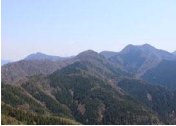
ヨコネから烏帽子（左）、三国岳（右）