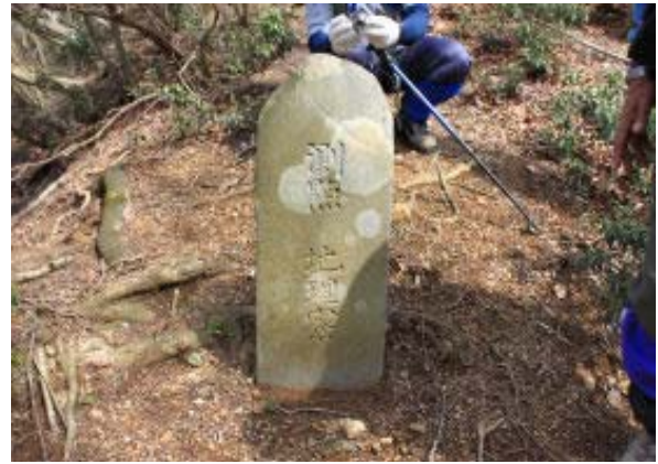
測量点（地理院の前身の地理寮） ①