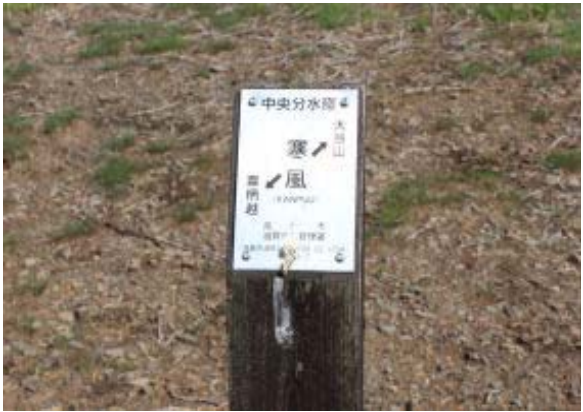
寒風 (高島トレイル)