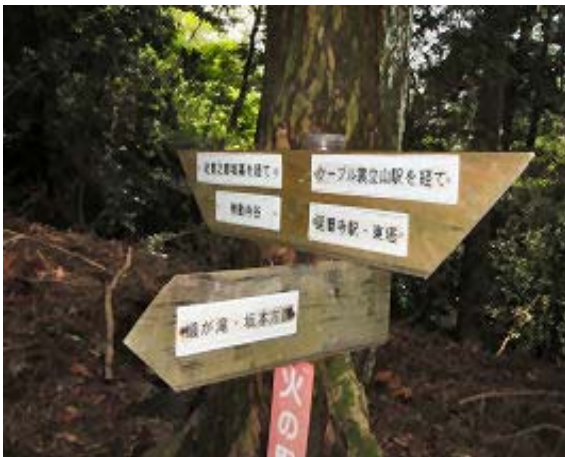
三叉路（坂本、裳立山）⑫