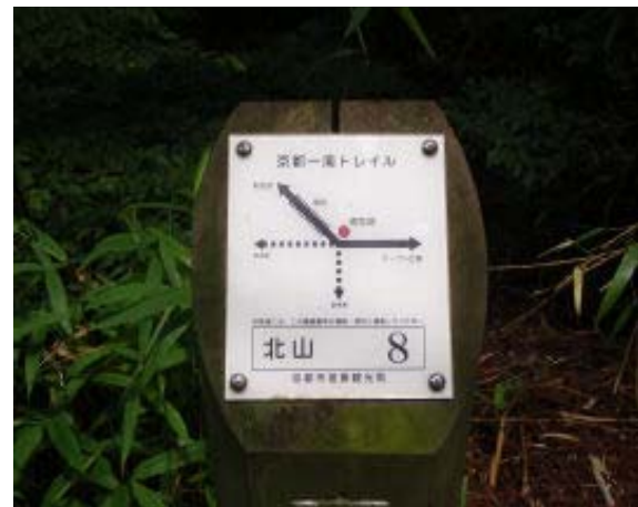
料金所の手前で左の道を選び椿堂経由でこの標識に行くことを推奨⑦