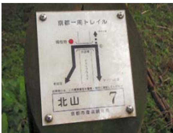
有料道路を鉄橋で越える⑧