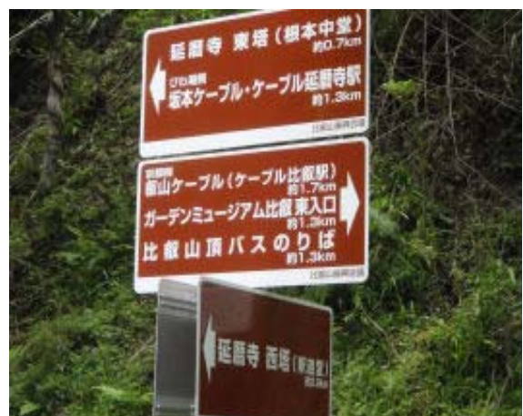
坂本ケーブルの方向に⑨

このコースで印象的な場所は、にない堂の苔のきれいさと恵心堂の静かな雰囲気との2点。今後、確認してみたいところは地点(0)の林道と地点⑭の分岐からの道の行き先。