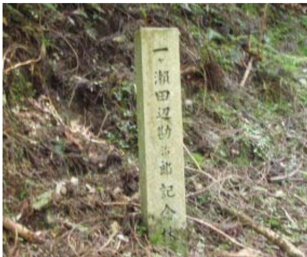
記念林石碑 (本坂への道) ①

823 観光駐車場 841 南善坊 852 記念林石碑 910 本坂 940-950 悲田谷分岐 (大宮分岐) 956-1010 延暦寺駅・昼食 1132 遠見岩 1144-1202 箸塚に戻り相応和尚墓⑤ 1216 遠見岩 1254 県道⑧