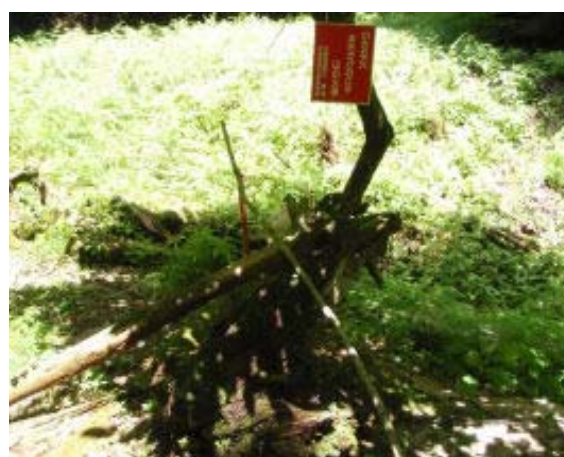
箸塚 この奥に道がある

梅雨も終わり、夏空になってきた。3連休ということで渋滞の予想される遠出はやめ、地元の比叡山に行く。