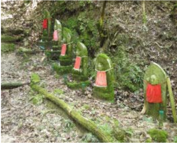
相応和尚墓の入口⑤