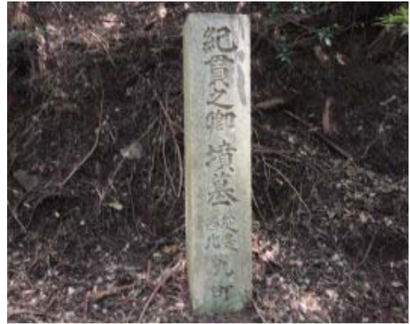
この標識から権現山コースに行ける⑥ この標識より林道となっています⑦