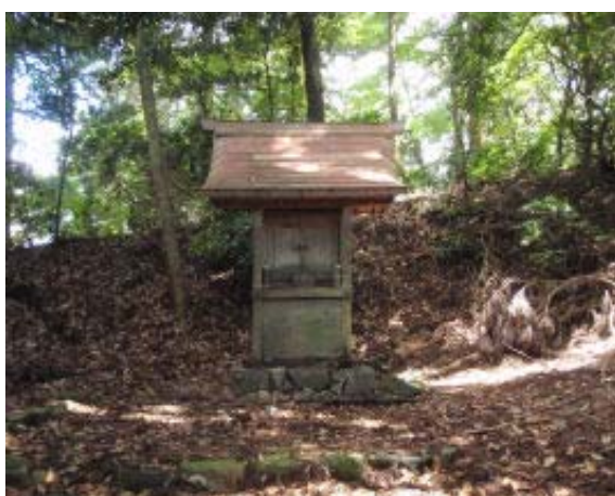
天梯ノ峰・権現社 ④