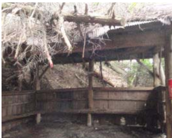
尾根より左に下り、休憩所に③