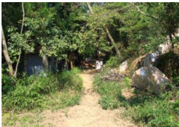
永興寺西の登山口

1110 御陵駅 1119 永興寺西登山口① 1129 御陵分岐② 1144-1159 地点⑨ (地点③に道なしを確認) 1205 地点④ 1235 山道⑤ 1243 林道下り⑥ 1309-1318 後山階陵 (地点⑦に大文字への道) 1339 疎水公園から大文字への道⑧ 1349 四宮駅