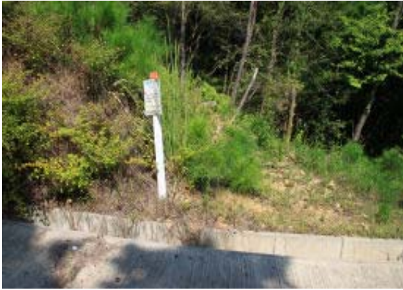
地点⑤ 登山道への道