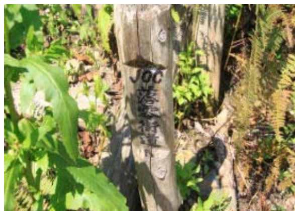
地点⑩ の左の階段のある標識 ; JOC 落零街道

今回は体調に合わせて、大文字山へのルート (御陵から1本、南の尾根2本、四宮から1本) を下見した。