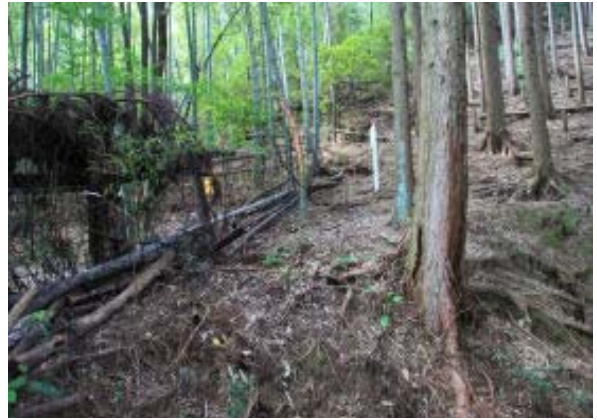
地点⑦ 大文字山への急な坂 疎水公園から大文字山への道⑧