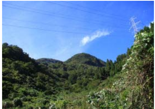
林道から大日（左が山頂）を

巡視路のある地点④までは除草がきちりされていたが、そこを過ぎると、踏み跡はしっかりあるが、時々、草が覆いかぶさる登山道を進む。ガイドブック（福井県の山 2007）では峠の前で旧道と合流する地図が記載されていたが、合流せず峠に。P1180 への上りは無茶苦茶きつい。あえぎながら上る。