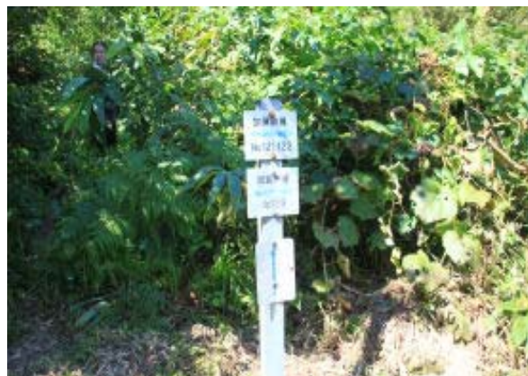
巡視路と登山道の標識④

先日、行きたい山を整理した。この越前大日もそのひとつ。取立山を登っているとうしろにどんと構える山だ。Yさんとふたり。