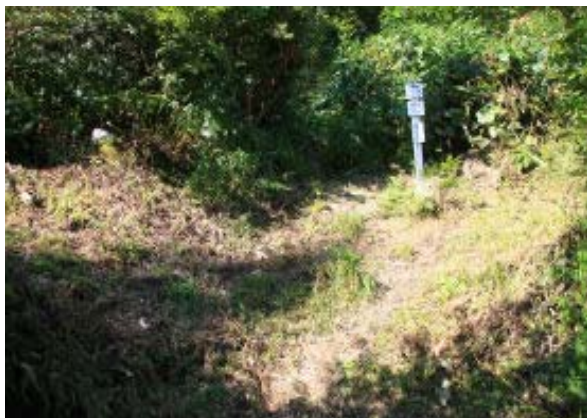
除草は巡視路まで④