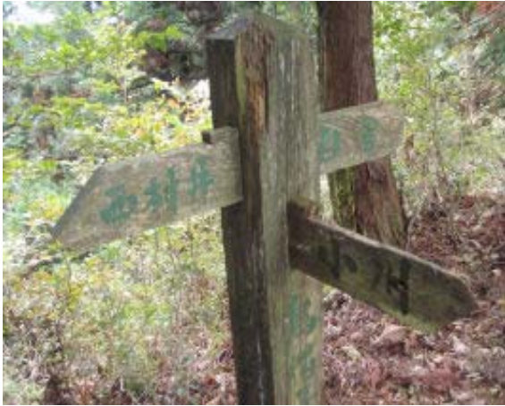
小川・標識（烏帽子峠）