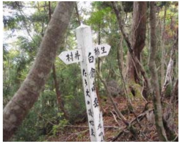
南岳・ブナの巨木数本