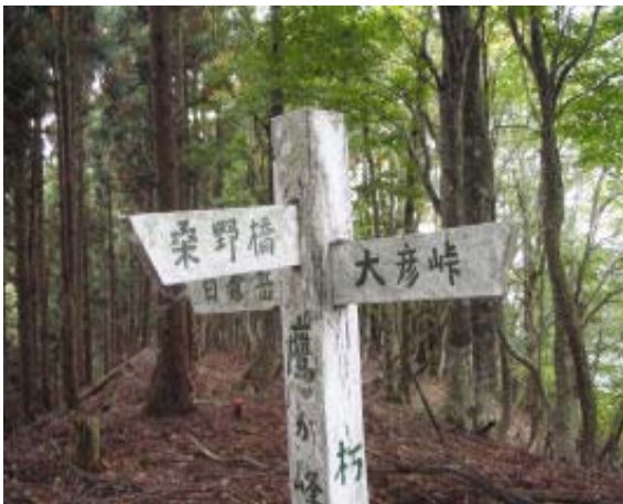
桑野橋・標識 (鷹ヶ峰)

856 林道・大彦峠① 935 鷹ヶ峰 1045 烏帽子岳 1116 白倉岳 1133-1214 中岳・昼食 1230 南岳 1333 栃生・登山口④