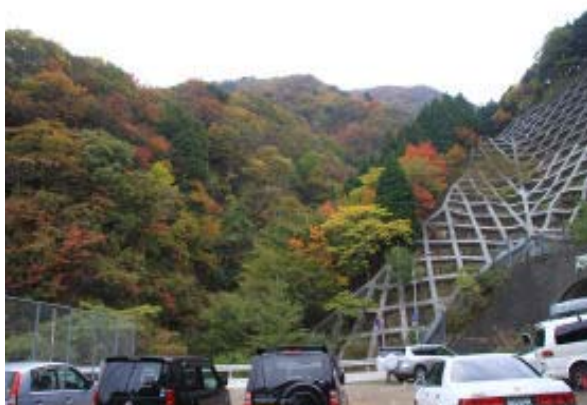
鞍掛トンネル西駐車場