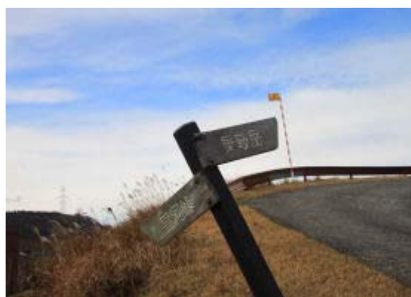
電波塔近辺の標識③