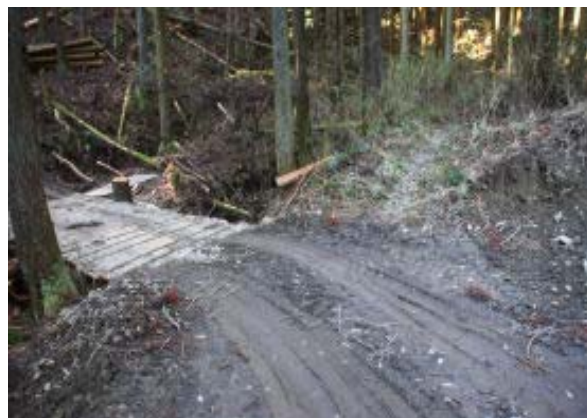
右の登山道を行く④