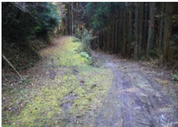
右が藤尾からの道 (Vターン) ④