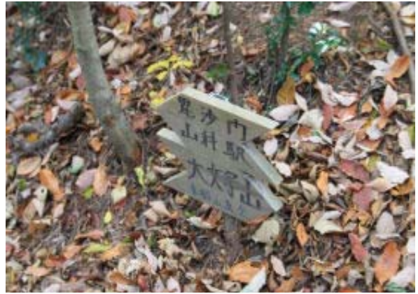
⑥ 山科への登山道は左