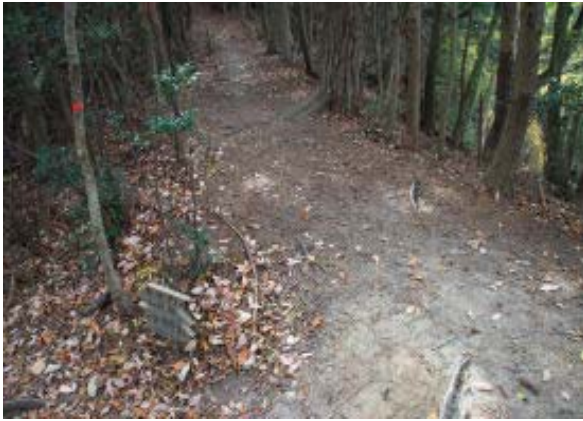
⑥ 左ではなく直進する