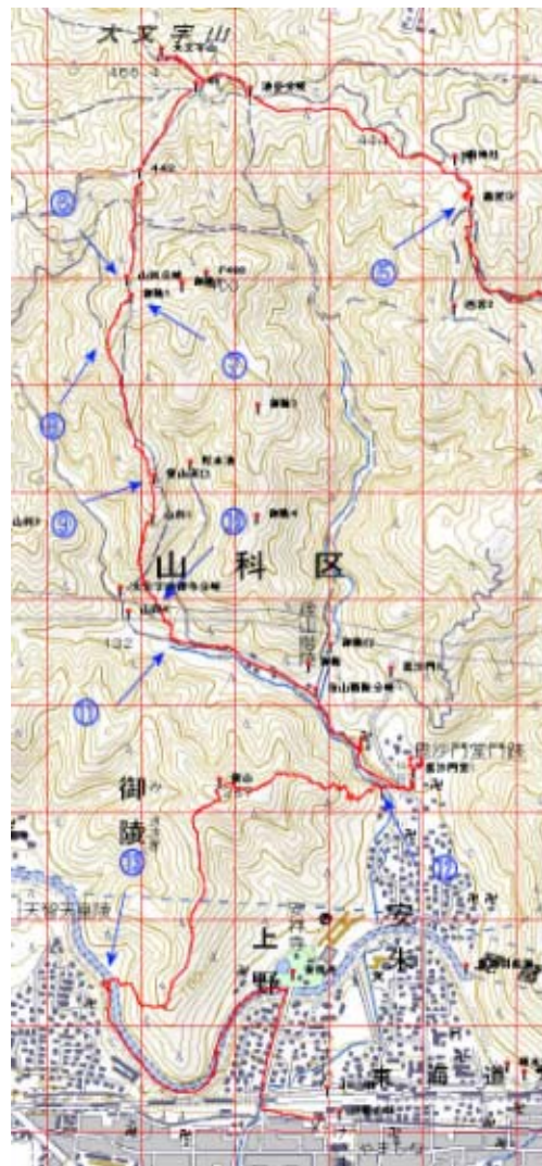
マップ1 (追分—林道 (Vターン))