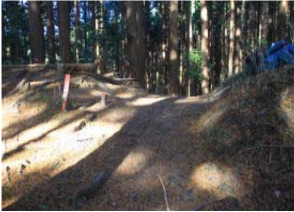
分岐⑤ 直進が雨宮神社