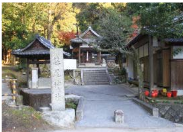
藤尾神社 (道は左の林道)

848 京阪追分 909-921 四宮団地?① 936 藤尾神社 1010 林道Vターン地点④ 1018 合流⑤ 1040-1111 山頂・昼食 1123 分岐⑦ 1147 合流⑩ 1206-1218 毘沙門 1239 鏡山 1257 琵琶湖疏水⑬ 1323 京 阪山科