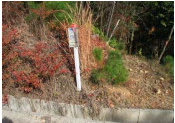
林道合流⑨ 林道から再び尾根に

鉄塔⑩より左に下ると安祥寺上寺跡への道と合流。安祥寺上寺跡までたどっておれば、すっかりしたのだが、今回は行かず。逆コースのときは、鉄塔⑩の巡視路に入らないと尾根コースを見逃すかも。