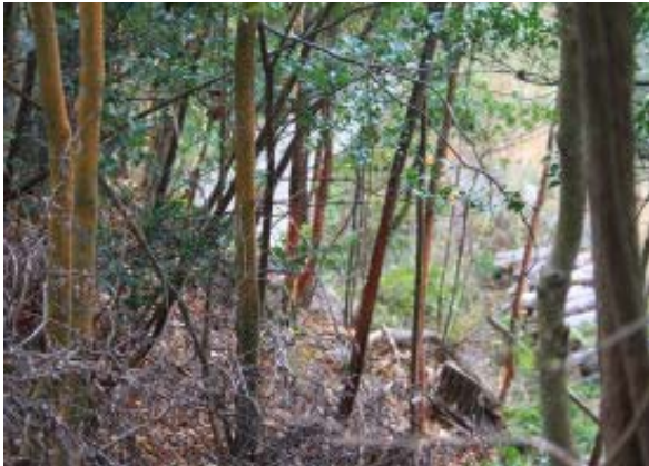
すぐに右手に林道が ⑧