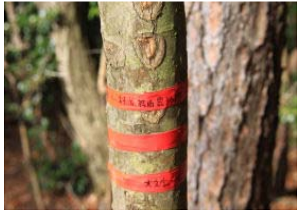
⑦ 直進が林道、左がP400尾根道