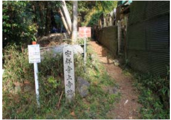
安祥寺上寺跡入口⑪