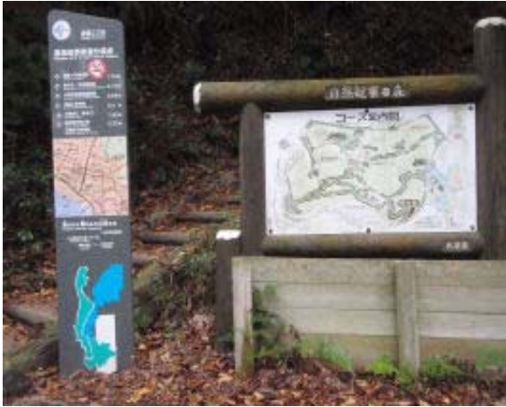
自然観察の森案内①

逢坂の関⑨から長等公園までは最初の少しの登りであとは、低い稜線をスタコラ歩く感じのゆったりコース。時々小雨がぱらつく中を進む。公園の手前に自然観察の森があり、新緑や紅葉時にはいい散歩コースになるのでは。