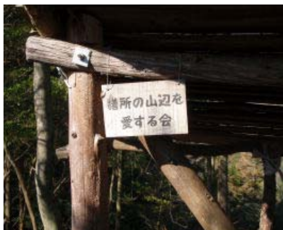
この辺を管理している団体 (2-2)