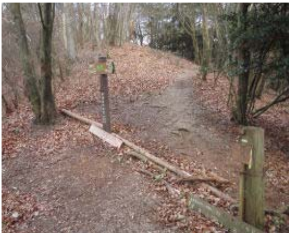
B B C 分岐⑤