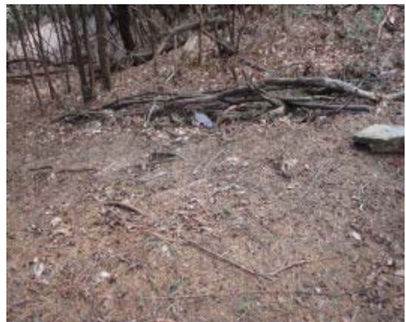
分岐⑨ 分岐⑩は巡視路