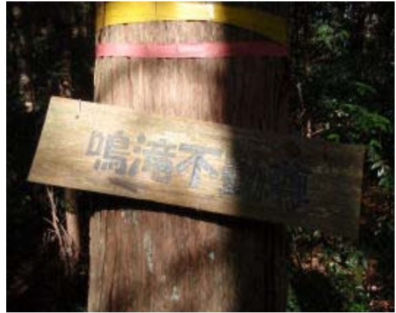
分岐③ 若葉台分岐と近接？