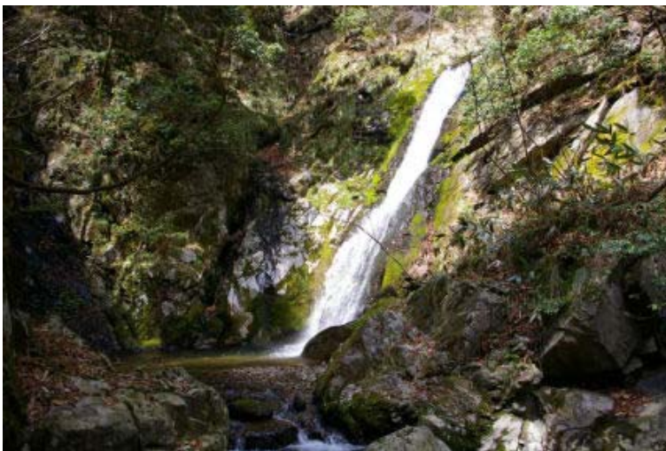
ナカノツボ谷の滝

林道ではイワウチワ、カタバミ、 イカリソウ、キケマン、エンゴサ ク、ショウジョウバカマがいきな り迎えてくれる。とくにイワウチ ワの群落は斜面のところどころに あった。イカリソウは群落ほどで はないが、数輪づつ、何箇所かで 観察された。樹木はコブシとキブ シの白と黄色が目立つ。