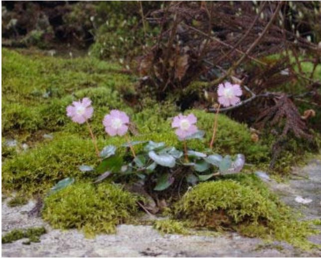
岩場のイワウチワ

2007.4.15 晴れ 芦生の森・櫃倉谷 7人 (K2 T Ya Yu I A)