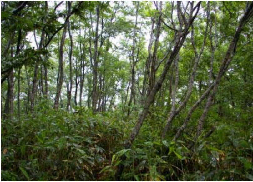
山頂付近のブナ林

目を楽しませてくれる。特にササユリ適当な間隔で咲いていたように思う。ゆるい尾根歩きになってから、ブナの林となってきた。T字路を左にとり、山頂に到着。標識はなく刈り取った笹のなかに三角点がポツンとあった。