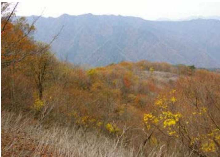
北峰あたりから白倉岳

いつもなら杉林の中や谷道でロストとなり、せつかくのGPSが機能を発揮しないという場面があったが、新GPSはさすがです。ロストなし。きれいなトラックを残してくれました。同時に持参したGPSは例によって、谷でズタズタでした。