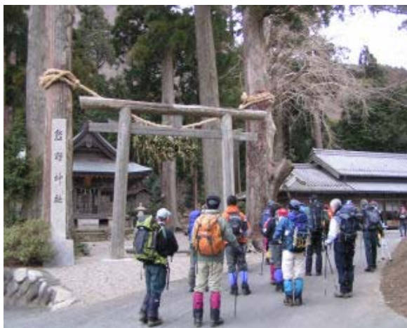
熊野神社スタート地点

833 熊野神社 951 文三ハゲ 1020 水無山 分岐 1053-1101 山頂 1109 竜王分岐 1121-1225 北峰下で昼食 1254 山頂 1330 P 992 1427 熊野峠 1528 熊野神 社