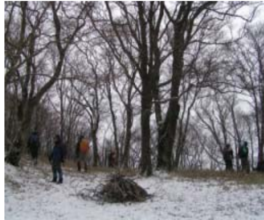
左 北峰への道から山頂をみる