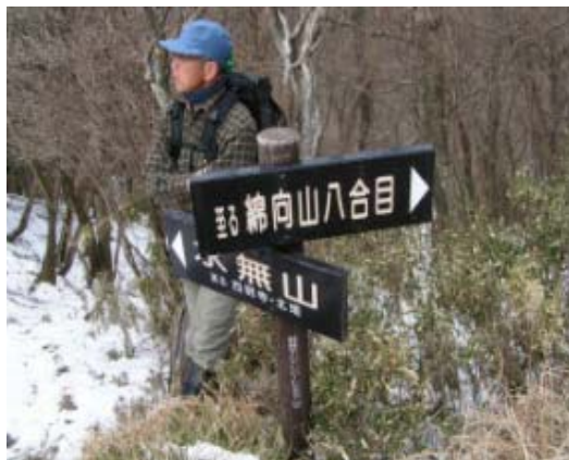
右 文三ハゲ上部 水無山分岐

雪のない綿向になってしまった。でも、表参道しか知らないゆえ、新コースを大いに期待する。結果的には文三ハゲ、北峰、ブナの木峠、熊野峠などを知る。