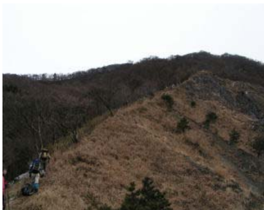
左 水無山分岐から綿向の南北稜線に向かう 右 山頂

雪のない綿向になってしまった。でも、表参道しか知らないゆえ、新コースを大いに期待する。結果的には文三ハゲ、北峰、ブナの木峠、熊野峠などを知る。