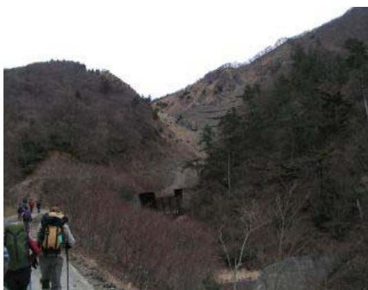
左 文三ハゲを望む林道歩き

833 熊野神社 951 文三ハゲ 1020 水無山 分岐 1053-1101 山頂 1109 竜王分岐 1121-1225 北峰下で昼食 1254 山頂 1330 P 992 1427 熊野峠 1528 熊野神 社