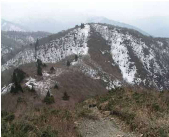
武奈より御前山、正面の白いルートが道

山頂で昼食をとり、同じ道を帰る。御前山のくだりは行きと異なり、正規のルートを見つけ、らくらく帰る。間違えた分岐点（雪のため分岐とはいえないが）に目印のテープを木につけておいた。あとからくる人の参考になればいいが。