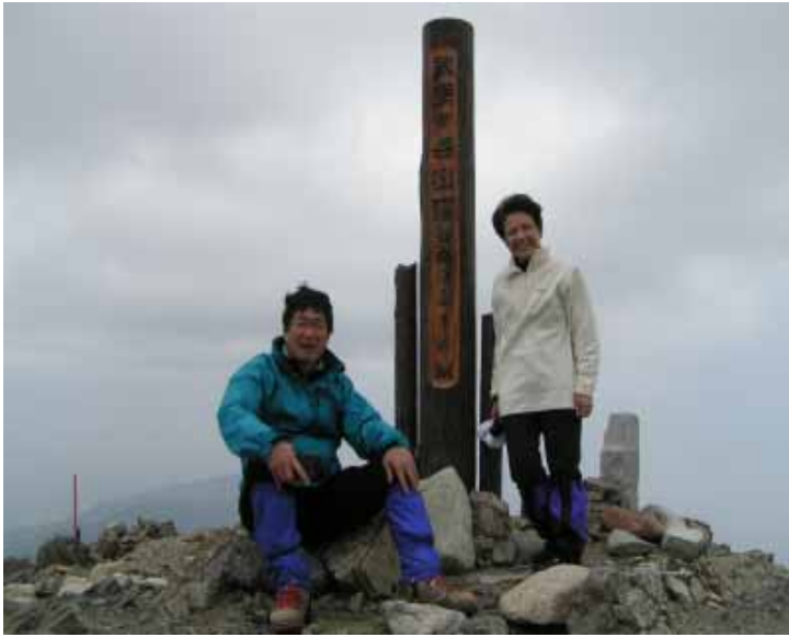
山頂での記念撮影

山頂で昼食をとり、同じ道を帰る。御前山のくだりは行きと異なり、正規のルートを見つけ、らくらく帰る。間違えた分岐点（雪のため分岐とはいえないが）に目印のテープを木につけておいた。あとからくる人の参考になればいいが。