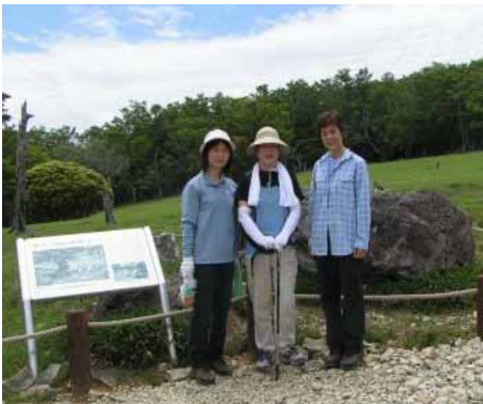
牛石ヶ原での記念撮影

牛石ヶ原では鹿を多く見ることができた。大蛇グラに行く途中でアカヤシオによく似たツツジに会う。帰宅後、アケボノツツジとわかったが、本当に似ていた。このツツジはシロヤシオと同様、大台の名物の花らしい。大蛇グラはあいかわらずの景色で、季節がら、アケボノツツジがめだった。