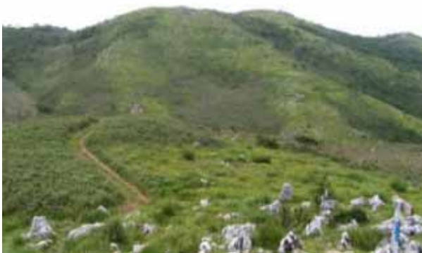
左 経塚山から三角点

家で GPS データを整理していると、 25000 のルートと相当違うことがわかる。