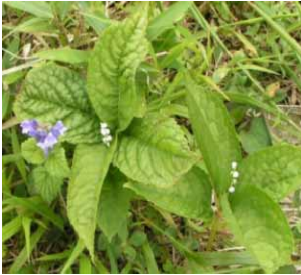
オオツナミソウ&ヒトリシズカ

ヒルも心配したが、あっさりとお猿岩につく。ここからはゆったりとした散策コースであり、お虎ヶ池をすぎ、経塚山のぼりにはいる。