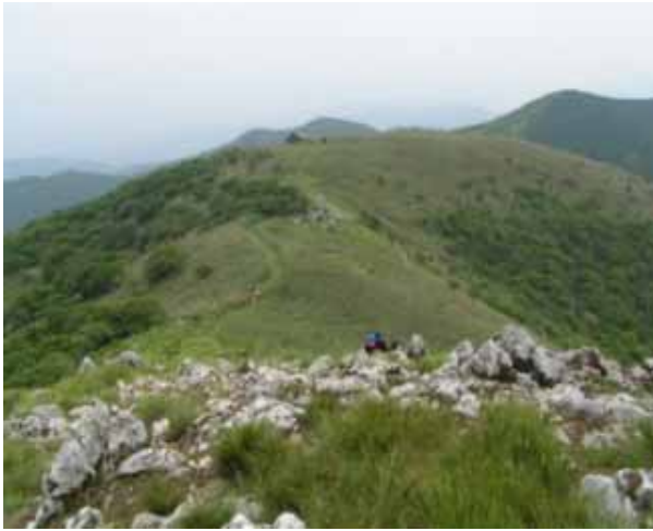
経塚山から避難小屋

家で GPS データを整理していると、 25000 のルートと相当違うことがわかる。