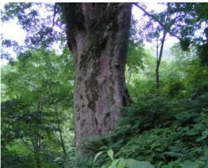
大きさは表現できていないが、でかい木

本日は3人。天候はガス。結構涼しいが、汗がひどい。タオルはグショグショ。きのうの大量ビールのせい、体調はNOT GOOD。でも栃の木は感激。スゴイのひとつ。花も池まではアジサイのみ。