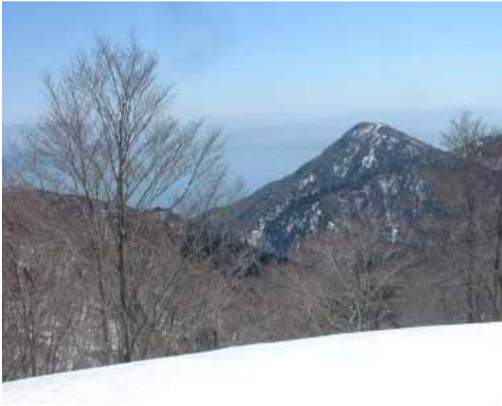
コヤマノ岳のぼりから堂満

北東方面は北の方から、白山、大日ヶ岳、横山岳、金糞岳、伊吹山、霊仙山、藤原岳などすっきり望むことができた。これからの武奈ののぼりのつらさを忘れるくらいの快適なコヤマノ岳ののぼりであった。