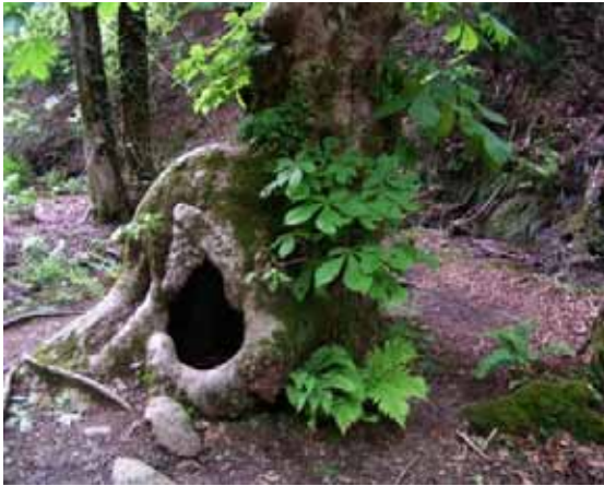
右 上谷の雰囲気その1