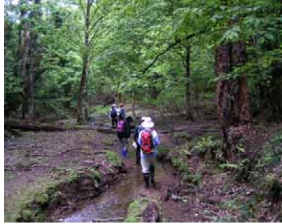
左 上谷の雰囲気その2