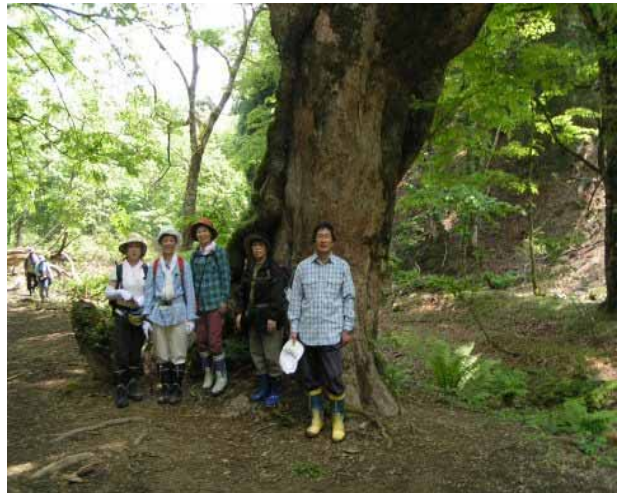
左 ミズナラの大木