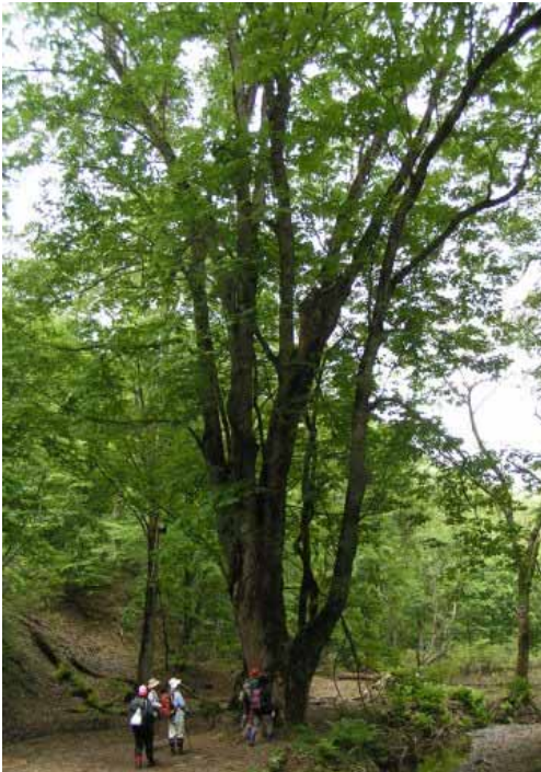
右 栂の木での記念撮影