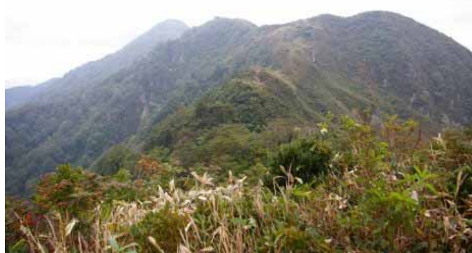
右 三周ヶ岳方面からの下りから夜叉ヶ池