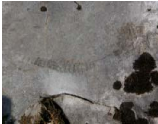
霊仙山南西尾根直下にあった化石

南霊岳近辺の稜線で昼食後、南霊岳の北尾根を下り、霊仙山を南西側より登る。この間、いたるところに福寿草の群落があった。霊仙の山頂で360度の景色を堪能した。北は伊吹、西は琵琶湖、東は養老山地、南は御池。