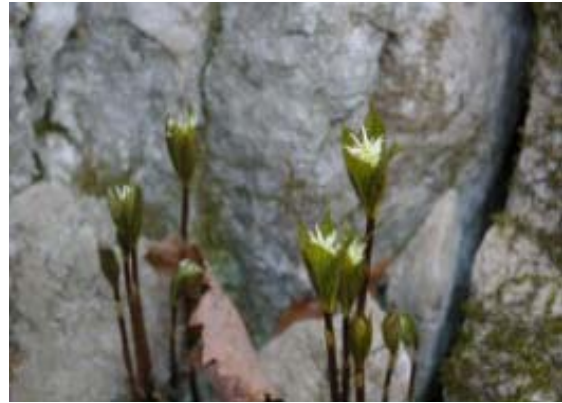
ヒトリシズカ 笹峠