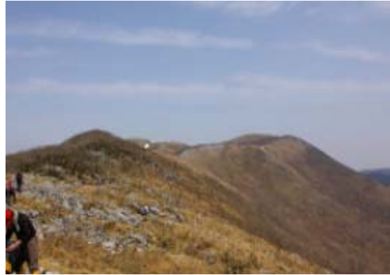
近江展望台から霊仙最高点への稜線