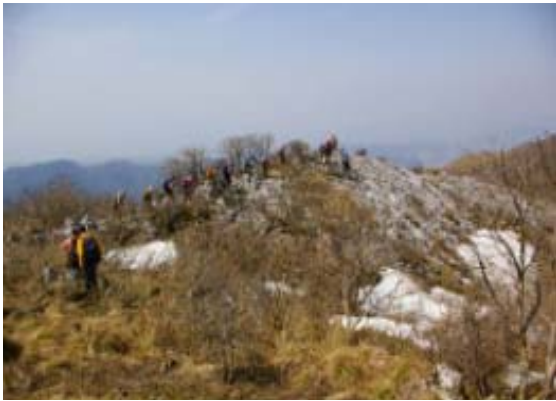
南霊岳の北尾根を霊仙に向け進む