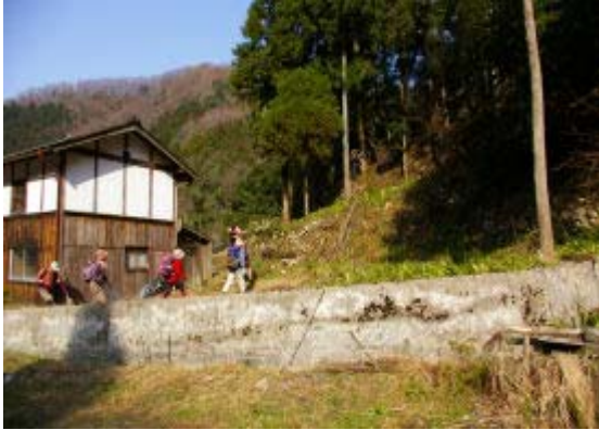
安原からの踏み跡なしの登り口