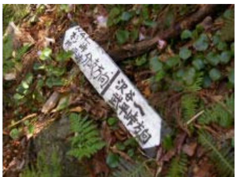
コクイ谷と沢谷との合流地点

815 西 P 851-855 一服峠 908 クラ谷分岐 924-931 沢谷とコクイ谷合流 956-1016 コクイ谷 出合 1027 上水晶谷左岸尾根取付き 1127-1140 P1066 1200-1258 P1155 1328-1336 国定公園 記念碑 1346-1354 西南尾根の巨岩 1430-1448 一 服峠 1508 西 P