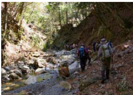
コクイ谷くんだり

久しぶりの御在所、かつ、西からのコース。 クラ谷の分岐までは特に花もなく、単調な登り。 沢谷、コクイ谷はイワウチワ、エンレイソウが多い。 新緑も目立ちつつあった。谷歩きも終わり、 上水晶谷の左岸尾根に取り付く。左手後ろ（北東） に釈迦、左に国見（東）、右（西）に雨乞を望む。 進行方向の御在所や