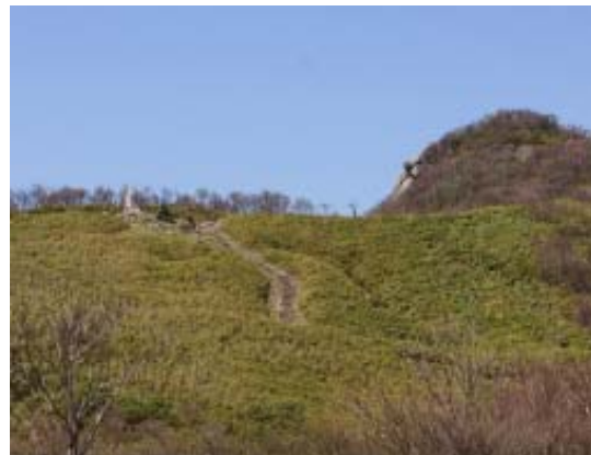
左が記念碑、右が左の写真のピーク

山頂の遊歩道にはタテヤマリンドウが多く咲いていた。また、至る所にアカヤシオがあった。ここで大休止し、御嶽神社の裏手より、西南の尾根に。すぐに巨岩があり、ここから鎌ヶ岳が正面に望め、アカヤシオを前面にした景色は最高であった。最初は結構なブッシュであったが、その後は雑木林のなかを快適に下った。沢谷峠で行きの道と合流し、パーキングに。