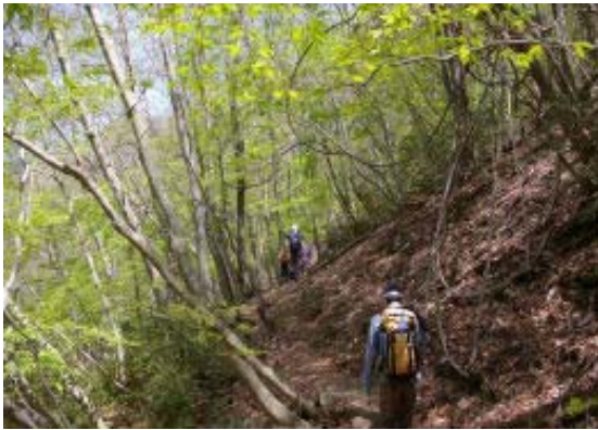
コクイ谷の新緑を上る

本日は体調はすこぶる良く、快調に P1155 に。ここで昼食だ。雨乞岳がドーンと西正面にある。ここから山頂までは 30 分、登るにつれ、タテヤマリンドウがちらほら、また、アカヤシオがさらに大きく目立ってきた。国定公園の記念碑に到着した。