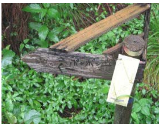
ポンポン山への道