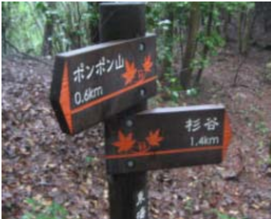
稜線にある杉谷への標識