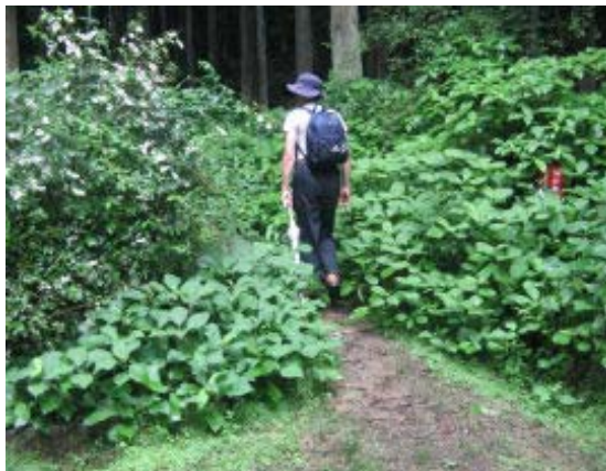
分岐で直進の谷道へ 谷道を進む