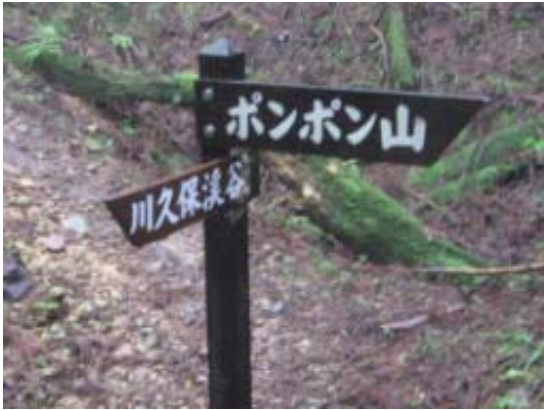
標識を無視して直進