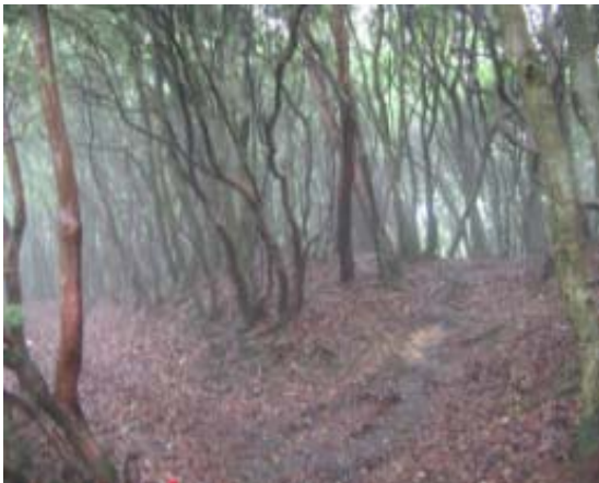
山頂近辺の自然林