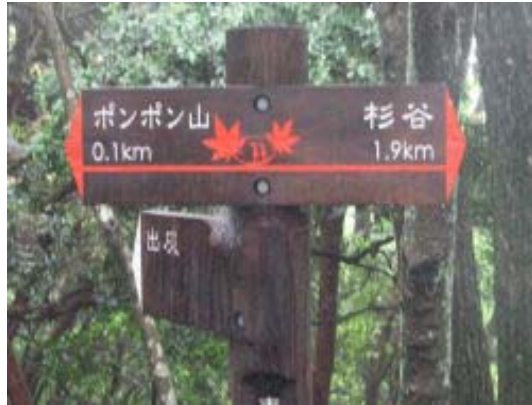
稜線の標識、あと 100m で山頂