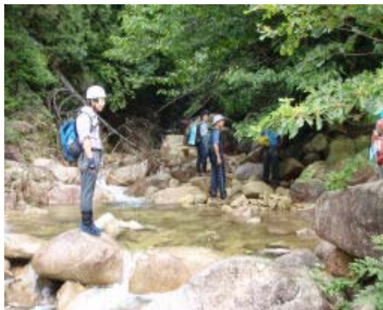
ツメカリ谷出合 ツメカリ谷を遡る