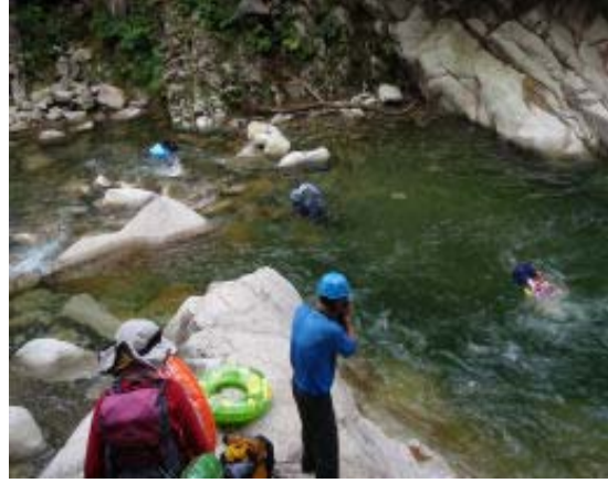
へつりに飽きて泳ぐひと