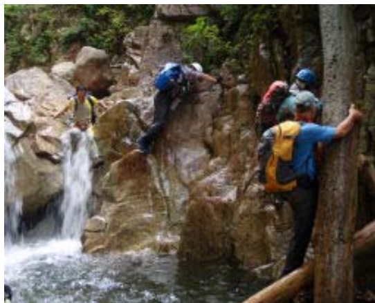
ツメカリ谷を下る

ツメカリ谷の出合から谷を遡る。ザイルの助けも受けながら、スダレの滝に到着。着替えて泳ぐ人もいる。下りは滝の場所では飛び込むひともしも2-3人。出合いで昼食。昼食後、みなさん浮きを膨らます作業にはいる。