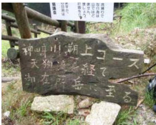
林道からの下りの標識