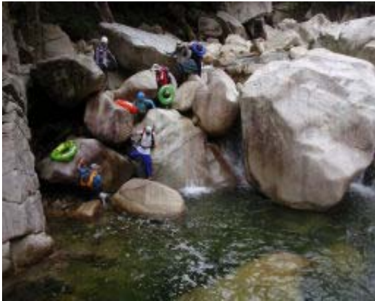
浮きを抱えながら神崎川を下る