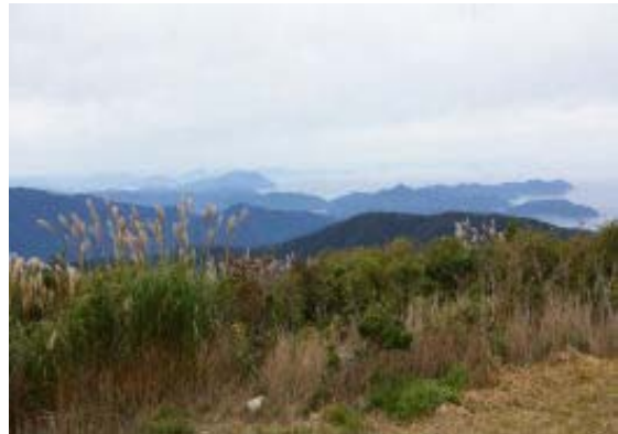
山頂より日本海（小浜方面）

秋の花は夜叉ヶ池に比べると少ないと思う。アキチョウジ、アキギリ、トリカブト、ツリフネソウなどであるが、多いのはアキチョウジとトリカブトくらい。 山頂からは日本海、琵琶湖など360度の眺望。昼食時に雨がぱらつきだし、ぐっと温度が低下してきたようだ。今年はいじめて手袋を着用した。