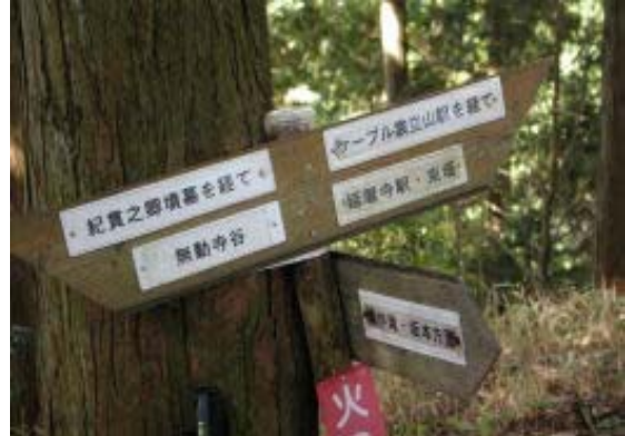
地図② 紀貫之墓T路（三叉路）