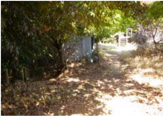
地図③ 初日の出展望台