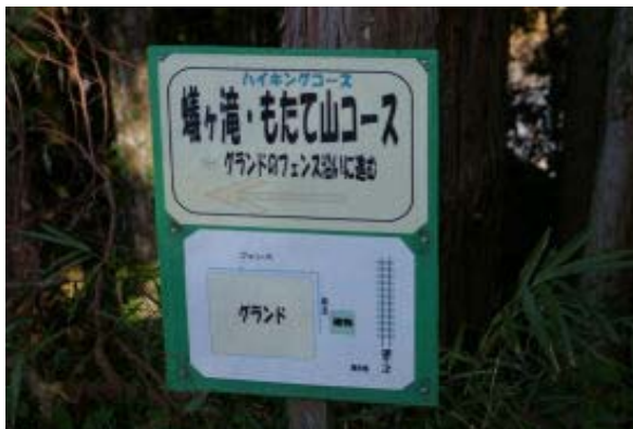
比叡山高校グラントにある標識