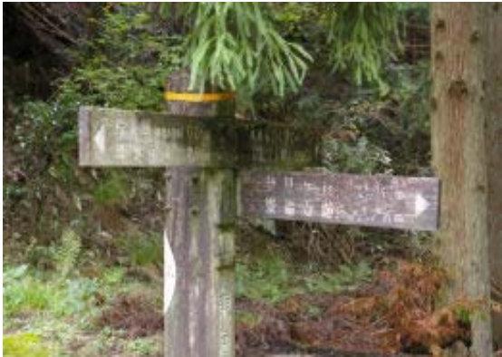
地図⑤の三叉路（振り返って撮った）