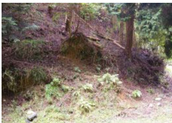
地図② 壺笠山か崇福寺跡への道？

1200 平子谷お墓上部 1226 壺笠山分岐① 1302 夢見ヶ丘 1320 壺笠山分岐⑥ 1342 崇福寺跡 1402 百穴古墳 1450 平子谷お墓 上部