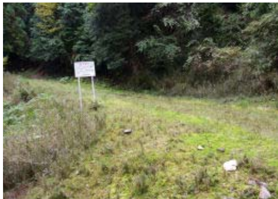
地図① 壺笠山への林道