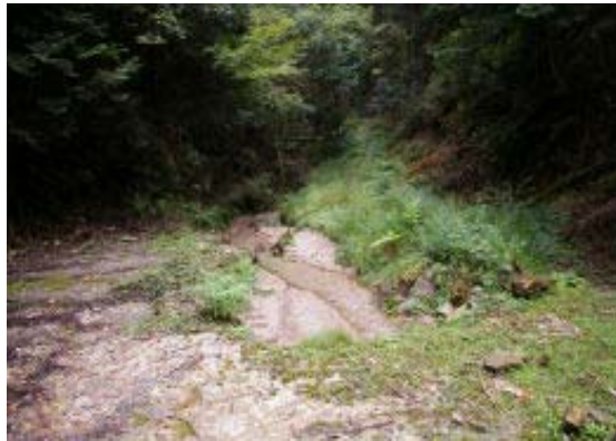
地図④ 林道が無くなる

平子谷にある登山道に大いに興味があり、上流側に進んだ。まず、左手に壺笠山への林道①と出会う。更に左手に壺笠山か崇福寺跡への道②、林道は二俣に別れ、右は川沿い、左は夢見ヶ丘方向と判断。林道も地図③地点で登山道となり、三叉路⑤となる。右手が無動寺谷方面、左が夢見ヶ丘方面だ。ここで戻る計画だったが、膝も順調ということもあり、明日予定していた崇福寺跡まで行こうと決めた。この三叉路にはアケボノソウが数輪あった。ことし初めての対面です。