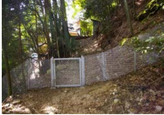
地図④ 玉照院下にある動物よけフェンス