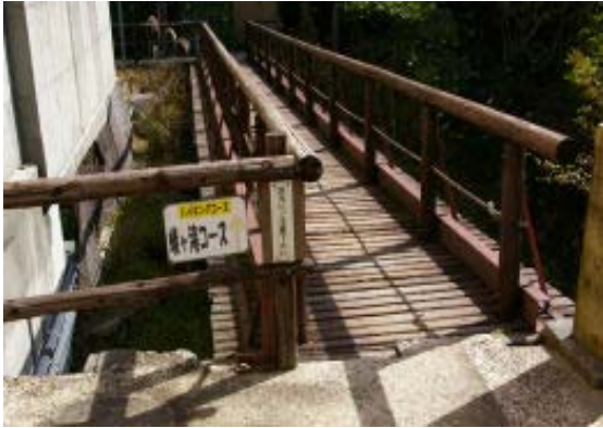
延暦寺駅そばのコース案内