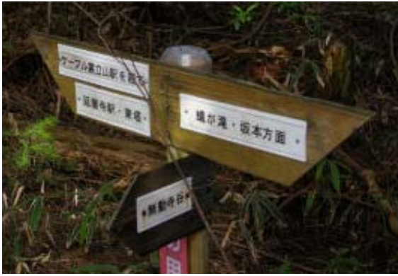
地図① 無動寺谷分岐