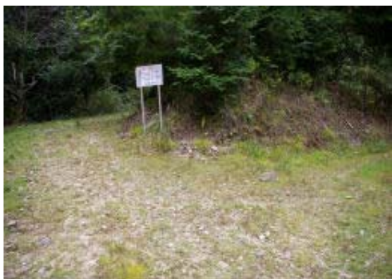
地図③ 林道の左を行く

1200 平子谷お墓上部 1226 壺笠山分岐① 1302 夢見ヶ丘 1320 壺笠山分岐⑥ 1342 崇福寺跡 1402 百穴古墳 1450 平子谷お墓 上部