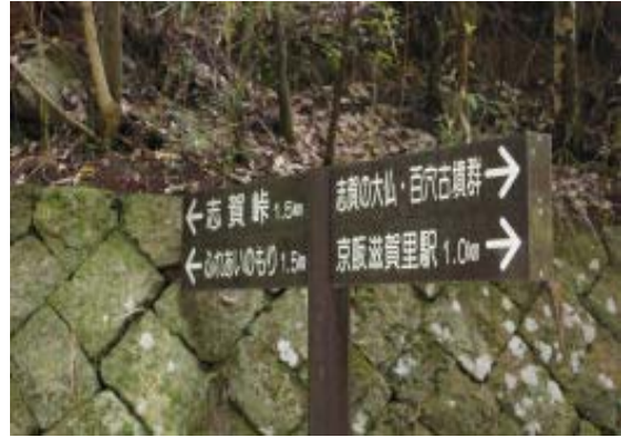
地点⑦ 左が志賀越、右が通った道 百穴古墳 地図⑧