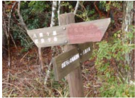
地図⑤ 八雲の滝分岐