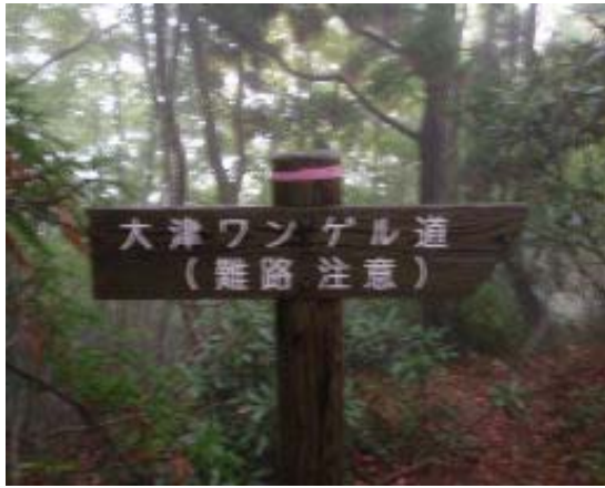
地図① 右手に下りる道あり