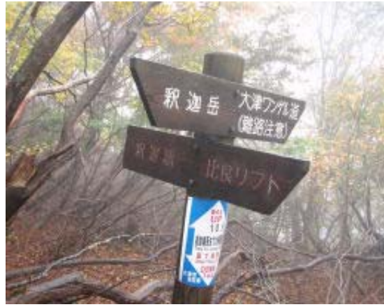
地図② 旧釈迦駅への道