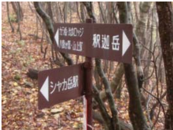
地図③ 旧釈迦駅への道

911 登山口 1134 釈迦岳 1157 カラ岳 1230-1251 旧スキー場跡 1327-1404 八雲経 由金糞峠 1450 大山口 1530 イン谷登山口