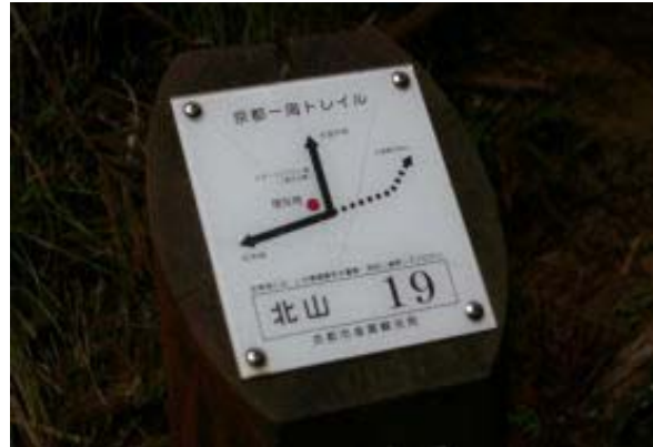
大原戸寺 (京都トレイル) 地図③

三千院の紅葉を楽しむつもりが雨のため、昼食の場所もなく、大原を即退散という結果になった。よって、紅葉見学もなし。