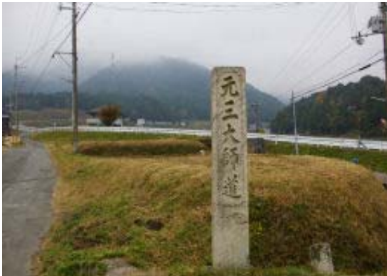
右が仰木峠への道 地図①