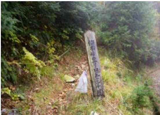
仰木峠への登山道 地図②

930 堅田 (バス) 948 上仰木 1018-1022 滝壺神社① 1047 仰木峠への登山道② 1056-1102 仰木峠 1146 上野町 1200 大原 バス停