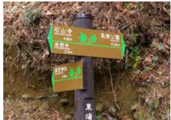
地点⑥ 地図にはない長等公園への道