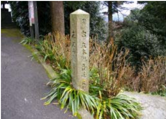
地点⑧ 立木観音への標識

地点⑨で北の道を近道と思って選択したが、行き止まりとなり、バイパス沿いの恐らく工事用であったろう急な勾配の道を利用してどうにか正規の道に合流。地点⑤の鳥居から奥宮神社に向かう。途中、地点⑥で長等公園への道を通る。千頭岳、音羽山に続いているのだろう。奥宮神社からの眺めがよく、比良、沖島、奥島山、三上山、湖南アルプスと望むことができる。ここで昼食とした。岩間寺への途中に岩間山への道、東笠取（地点⑦）への道を通る。岩間山の山頂はDOCOMOの基地があり、立ち入り禁止とのこと。岩間寺はボケ封じで有名な寺のようであり、平日であったが、お参りの客は結構いた。当然のことながら、真剣にお参りする。地点⑧は立木観音への分岐であった。岩間寺の駐車場から車道をくだった。