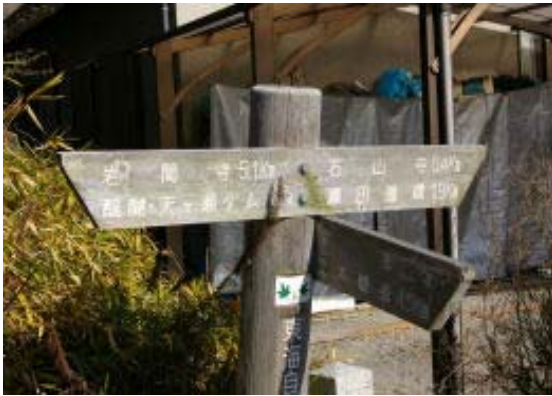
地点① 岩間寺 5.1Km 標識