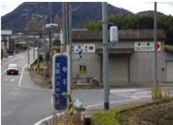
地点③ 中千町にある標識

1030 京阪石山寺 1125 地点⑨ 1147 地点④ 1329 鳥居・地点⑤ 1227-1245 奥宮神社・ 昼食 1259-1310 岩間寺 (正法寺) 1329 鳥居 1349 地点⑨ 1438 京阪石山寺