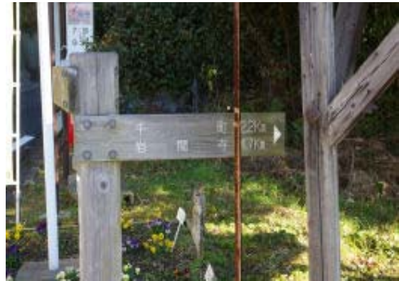
地点② 岩間寺 4.7Km 標識