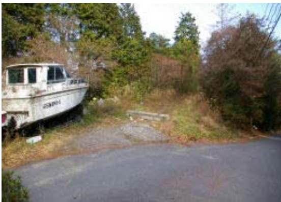
地点④ (上部の道から正規道に合流)

1030 京阪石山寺 1125 地点⑨ 1147 地点④ 1329 鳥居・地点⑤ 1227-1245 奥宮神社・ 昼食 1259-1310 岩間寺 (正法寺) 1329 鳥居 1349 地点⑨ 1438 京阪石山寺