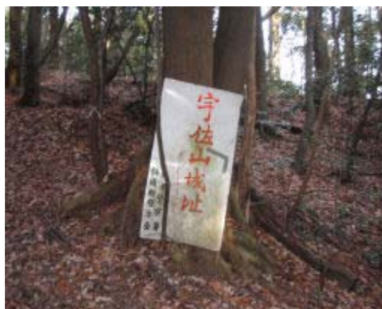
宇佐山（城址）登山口

駐車場にもどり、車にて法明院の入り口に。皇子山公園の全体像を理解し、結構な大きさに感心する。