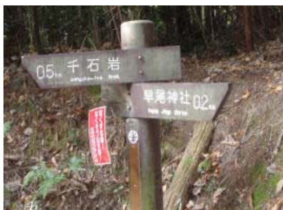
地点⑤にある千石岩への標識

皇子山にある千石岩は大文字山への北からのルート上の道として、大いに気になっていたが、漸く実現。千石岩への道は早尾神社の手前にある右手の道をひたすら登る。残念ながら、それは知らなかったもので北の方(千石台の団地の下)をうろうろしてしまった。登山道には千石岩の標識が数個あるので不安はない。千石岩は本当に大きく、この上から琵琶湖方面を観察できる。千石岩は周囲を一周できる。西に進むと、ゴルフ場のクラブハウス