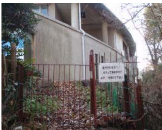
地点⑥ クラブハウス裏の柵