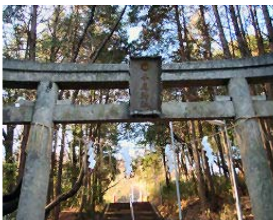
地点③ 早尾神社鳥居

1258 公園駐車場 1316 千石岩・早尾神社分岐 (地点④) 1339 千石岩 1346 クラブハウス柵 1417 地点④ 1429 公園駐車場 車移動 1442-1450 法明院 車移動 1502-1514 宇佐八幡宮一字佐山登山口