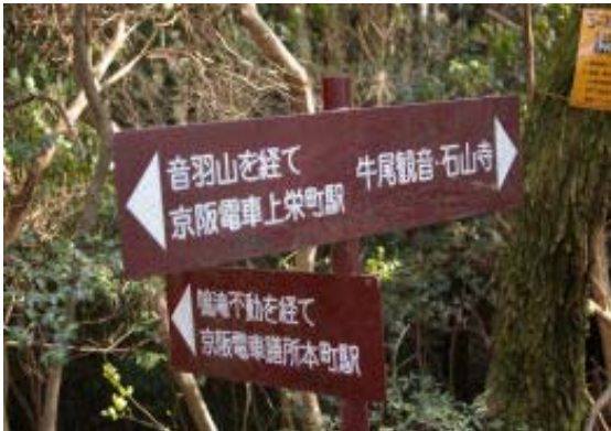
鳴滝不動への分岐（地点⑥）