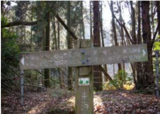
東海道自然歩道、石山寺への道