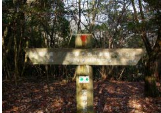
P 546 での標識