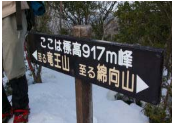
地点② 917 峰

本日は晴れということで、景色を大いに期待して出発。当初、北参道・奥の平から五合小屋だったが、なぜか、先日通った3合の林道から3合小屋からの表参道に変更され、幾分がっくり。が、7合から上部の樹氷の景色は最高であった。青空なら一層良かったのだが。圧巻は竜王への稜線の樹氷の景色。本当に興奮して、バチバチ撮ってしまった。この感動は久しぶりだろう。山頂からは180度の展望を大いに楽しむ。北尾根を下り、寒いなか昼食を取る。