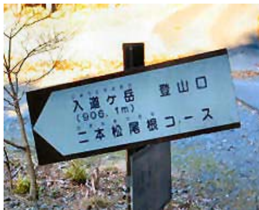
二本松尾根案内 地点②