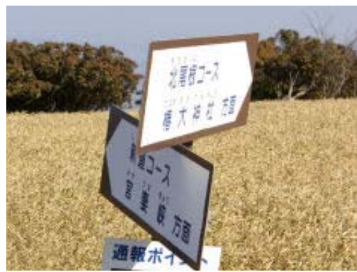
宮妻溪分岐・地点⑦