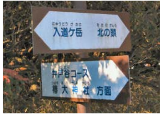
井戸谷コース分岐・地点⑥