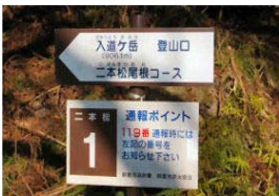
二本松尾根登山口 地点③

907 椿大神社P 919 二本松登山口 1006 滝谷分岐 1104-1114 山頂 1125-1156 奥 宮・昼食 1204 北の頭 1250 P 498 1332 北尾根分岐 1340 椿大神社P