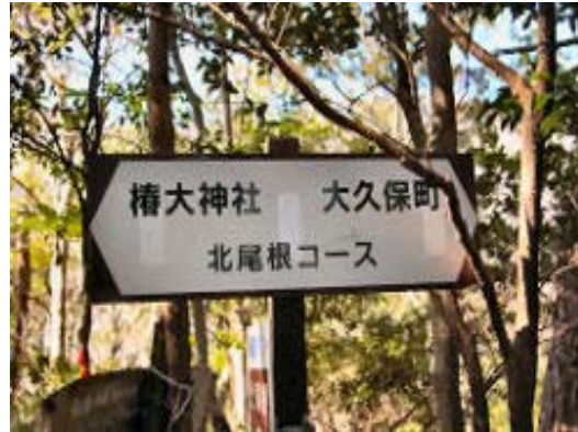
大久保町分岐・地点⑨

山頂からの眺望はすばらしい。残念なのは雪がほとんどゼロということ。北に鎌と御在所、南西に仙ヶ岳、水沢岳の奥に雨乞の雪景色。井戸谷分岐・地点⑥を過ぎ、奥宮で昼食。北の頭では雪の少ない綿向もみることができた。北尾根も思い切り急な下りだ。地点⑨の避難小屋、地点⑨の大久保町分岐を経て、北尾根の分岐・地点①の戻る。ここのアセビの群落、雪景色に興味があり、是非とも、訪れたいところだ。