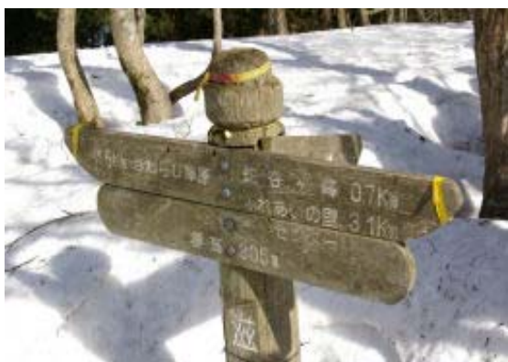
さわらび草原分岐・地点④