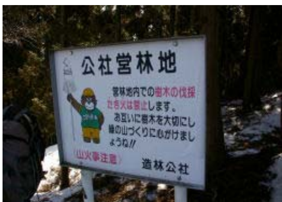
造林公社看板・スキー場分岐・地点⑤