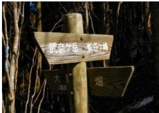
須川峠 (ボボフダ峠) ・地点②