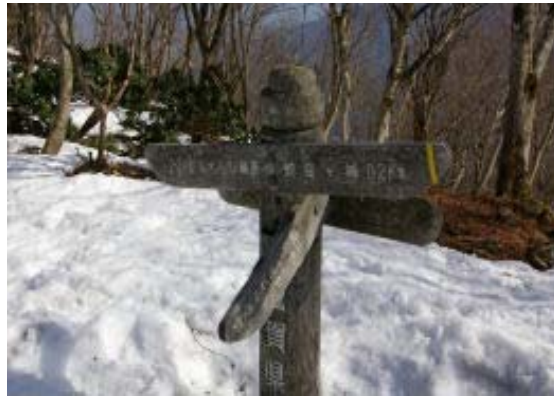
ふれあいの里分岐・地点③

比良のSH例会初参加ということで記念すべき1回目。雰囲気もよく、次回も参加したいと思う。