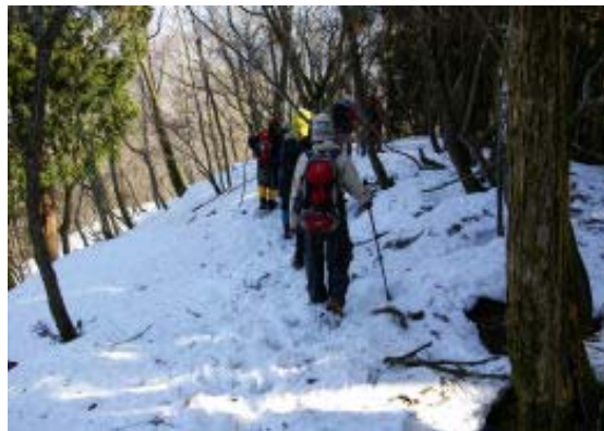
下りはワカン装着