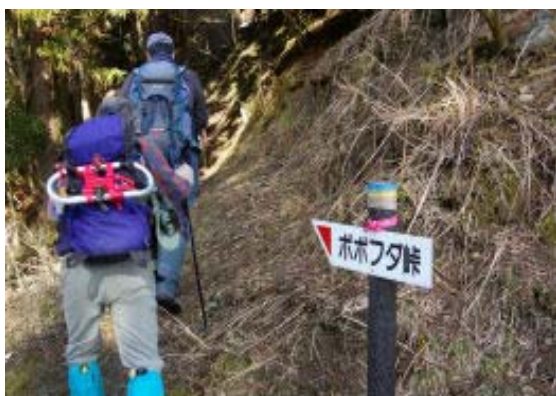
牧柵を越え、峠に向かう (地点①)