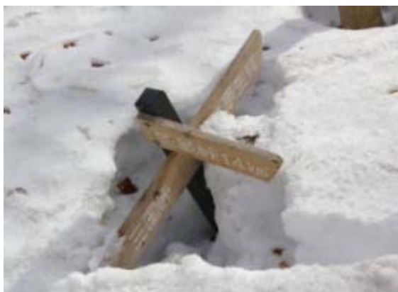
高島トレイル標識（地蔵峠—三国峠）

855 駐車点 917 ワカンジ谷を離れる 1010 登山道と合流 1025-1039 三国峠 1123-1212C a 800・昼食 1217-1227 最高 点 1346 枕谷左俣・三国峠北面経由、合流 点 1439 ワカンジ谷 1439 駐車点