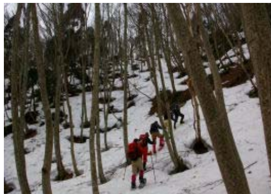
江丹稜線への登り