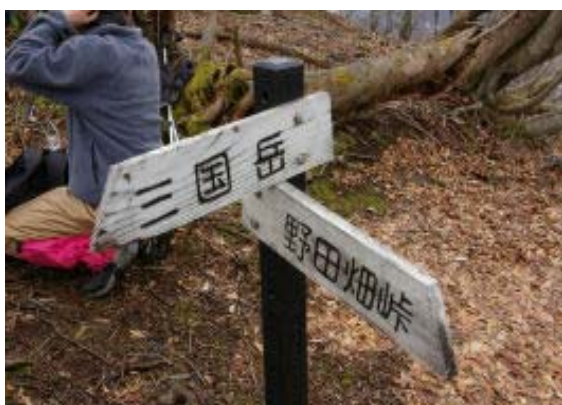
C a 800