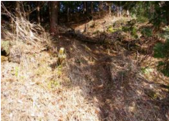
林道への下り口 地点④

今回はP 1194 には少しの残雪があったが、福寿草がところどころに見られた。また、T字尾根への下りの場所が異なっていたが、リーダーの判断の違いなのかなと変なところで感心する。