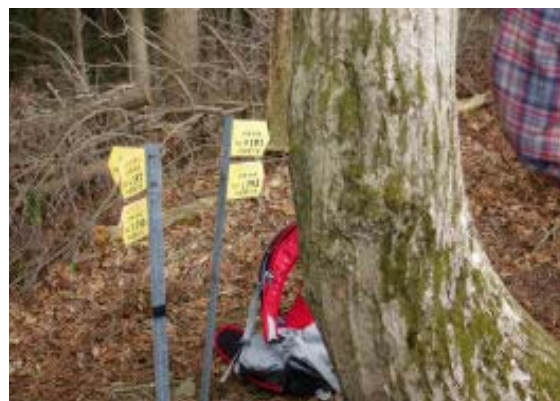
ノタノ坂 茨川への標識 地点③