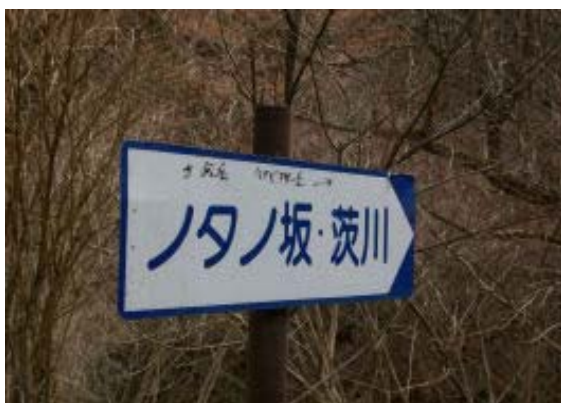
ノタノ坂分岐 地点②