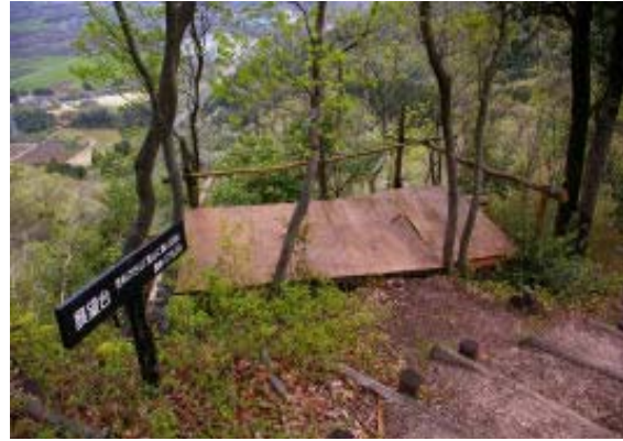
手作りの展望台 地点⑧