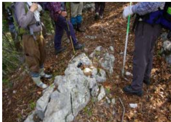
地点① 河内からの道と合流