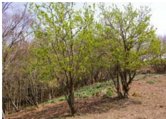
岳の峠のゴマギ 地点②

この山も気になる山のひとつであったが、行く機会を失っていた山。今年に入ってから、栗栖から保月を経て306号に抜ける林道を車で走っていたので、おおよその雰囲気はわかっていました。今回の山行はおおまかには山歩きと林道歩きが半々であった。トピックとしては、岳の峠近辺のわらび、林道のノカンゾウやイタドリなどの山菜を勉強させてもらったことと、このコースが春の花満載のコースであったこと。林道歩きの良さ(花満載)については湖北で十分にわかっていたのだが、鈴鹿の林道も期待を裏切らなかった。