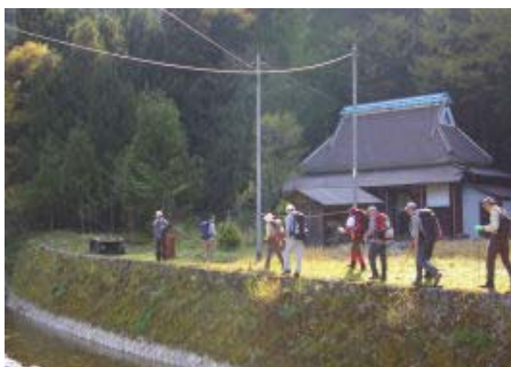
民家の左手に登山口