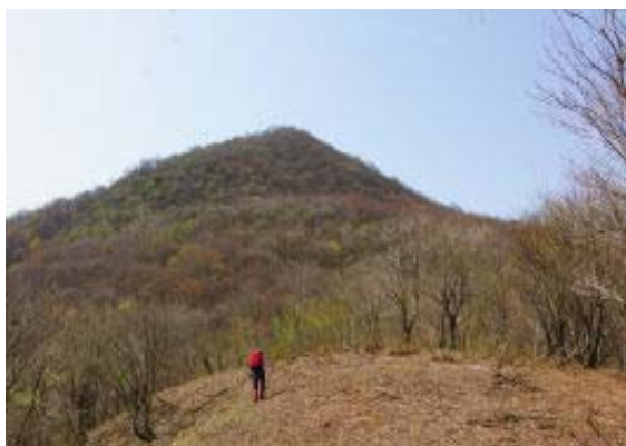
岳の峠あたりから山頂

816 駐車場 829 登山口 956 岳の峠 1025 岳の畑・地点③ 1039 岳の峠 1115-1209 鍋尻山・昼食(南尾根・地点④) 1230 P 709 1310 林道 1430 白谷分岐 1500 行者分岐 1544 登山口 1600 駐車場(岳の峠から岳の畑で1時間弱の休憩)