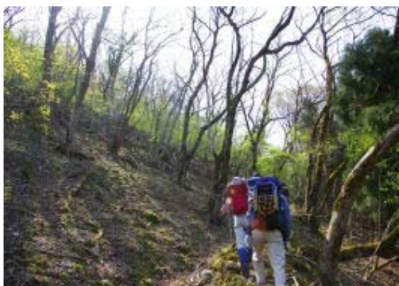
新緑の尾根を登る

816 駐車場 829 登山口 956 岳の峠 1025 岳の畑・地点③ 1039 岳の峠 1115-1209 鍋尻山・昼食(南尾根・地点④) 1230 P 709 1310 林道 1430 白谷分岐 1500 行者分岐 1544 登山口 1600 駐車場(岳の峠から岳の畑で1時間弱の休憩)