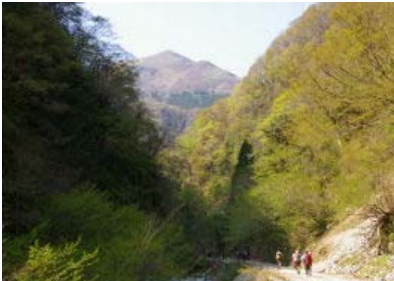
近江展望台の見える林道歩き