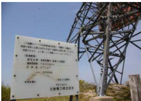
疋田反射板・地点④

929市橋駐車場 1102谷道終点 1118-1126 稜線・地点② 1135-1143夕暮山(手前P) 1209-1241岩籠山・昼食 1248-1251インディ アン平原 1304P708 1352P361 1408ドラ グインしのはら