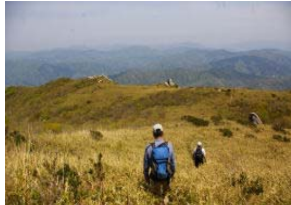
インディアン平原に下る