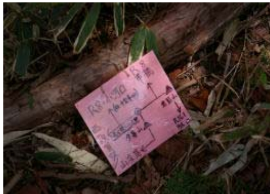
地点④ 小河口への標識

この山は行きたかったのだが車2台がベターということでタイミングを失っていた。連休の山行でようやく実現。市橋からの谷の登りで花があるのかなという期待で登ったが、キラソウ、チゴユリ、キスミレ、サワハコベ、イカリソウなどが時々ある程度。沢から離れ稜線(地点②)に向かう登りは急な坂。稜線から夕暮山への歩きはゆったり歩き。反射板や夕暮山(勘違いで三角点は踏めず)からは野坂岳や岩籠山、滋賀の山並みを見ることができる。地点⑤には小河口への標識があった。