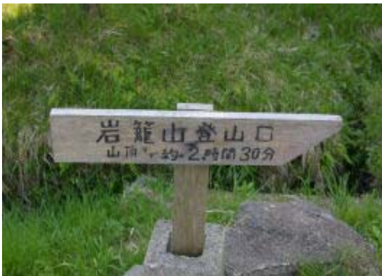
駄口登山口 (ドライブインしのはら)

岩籠山の山頂で食事とした。インディアン平原を望みながらの昼食であった。インディアン平原はササと大きな岩が特徴。地点③の分岐にもどり、駄口コースを帰路にとる。途中のブナ林の新緑を楽しみながらだった。たまたま、フデリンドウも見つけることができた。