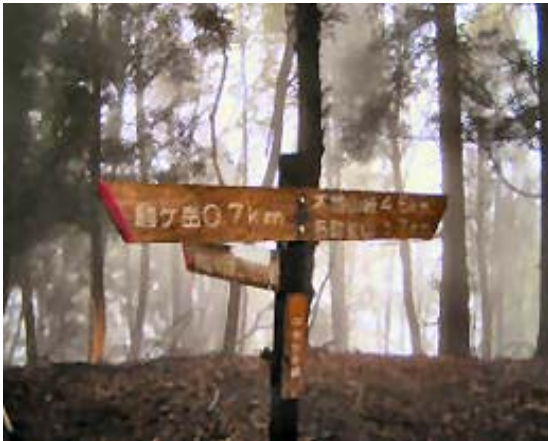
木地山中小屋への標識 地点⑥

稜線のブナは巨木が多い。湖北にブナ林は結構あるのだが、若いブナ林が多いように記憶している。巨木とガスと題材が最高なのに写真の出来は×。71104・秋ではほとんど同じコースだが、P682の下のブナ巨木と池に寄り道している。今回はブナの新緑に加え、春の花も観察できた点がよかったと思う。ハシリドコロ、ギンリョウソウ、サワハコベ、テンナンショウなど。帰りに朽木の森の近くでハンカチの木も観察でき、初めて見たわけではなかったが、改めて、ハンカチによく似た苞（花でも葉でもない）に感心。