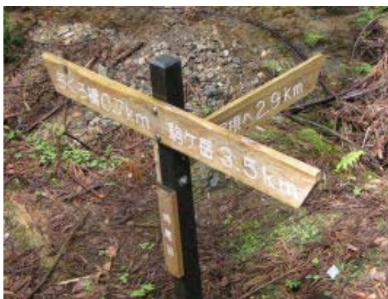
南尾根と西尾根の分岐・地点①