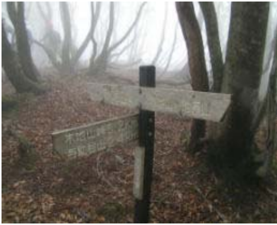
もうすぐ山頂の標識 地点⑤