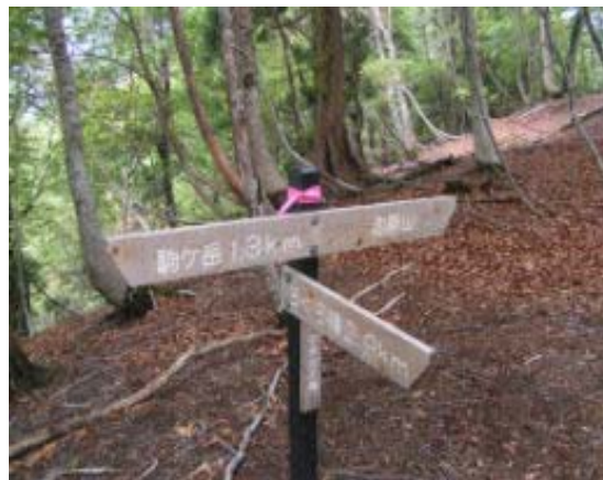
池原山への分岐・地点③