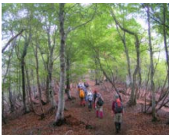
駒ヶ越までの稜線

1014 木地山B S 1124 尾根取付き② 1202 南尾根取付き③ 1242-1324 駒ヶ岳・昼食 1341 西尾根下り⑥ 1446 東谷との合流① 1454 木地山B S